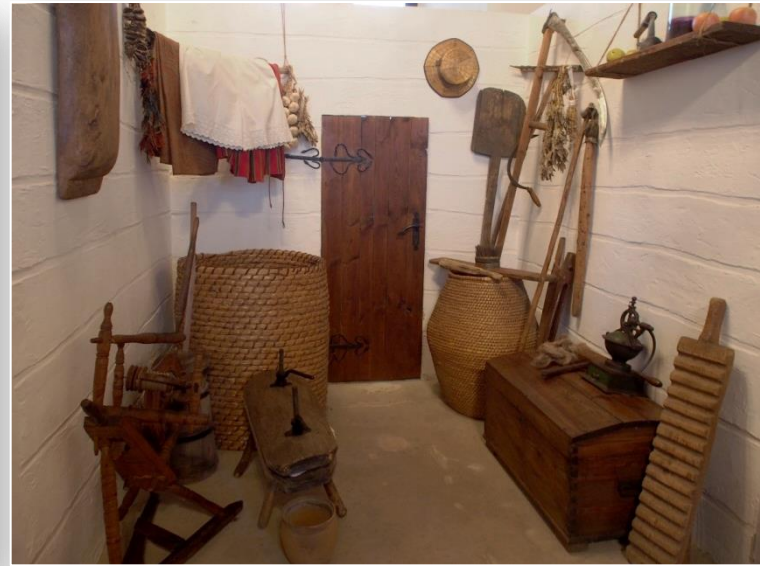
Ekspozycja sztuki ludowej regionu łęczyckiego w Zamku Łęczyckim