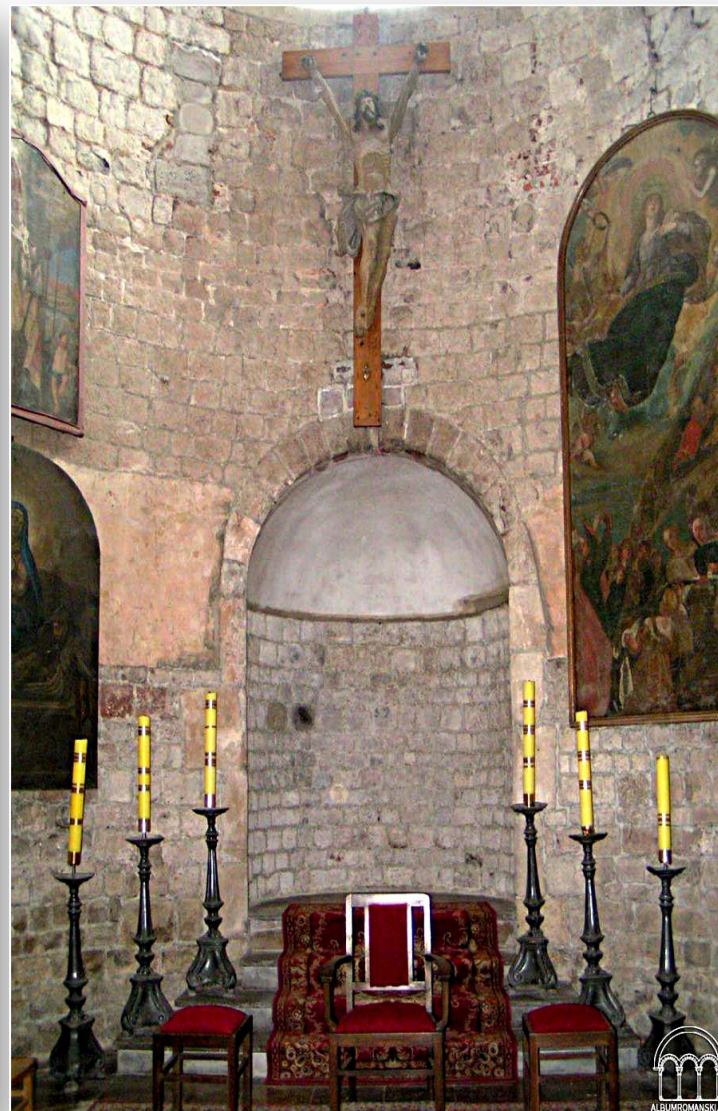
Wnętrze Kolegiaty w Tumię