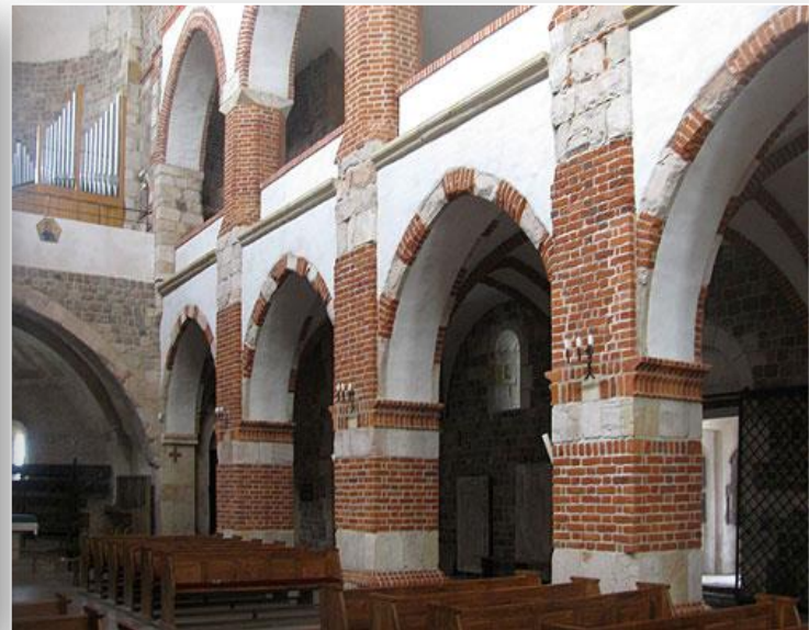
Wnętrze kolegiaty w Tumi