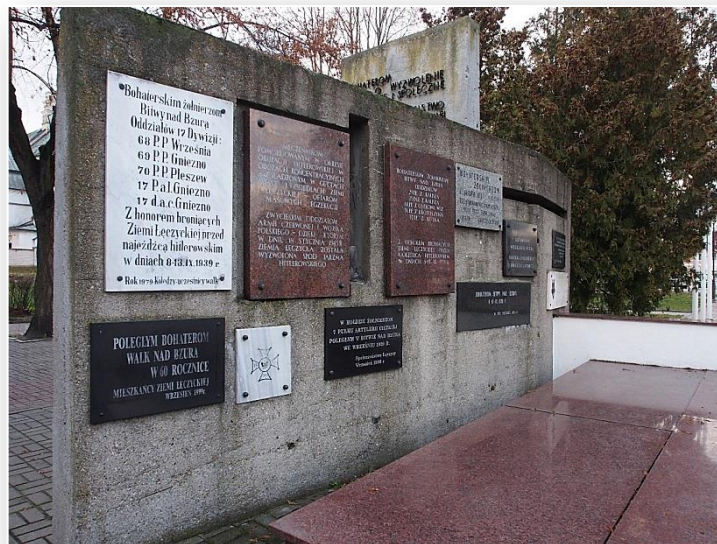
Pomnik upamiętniający bitwę nad Bzurą podczas II wojny światowej