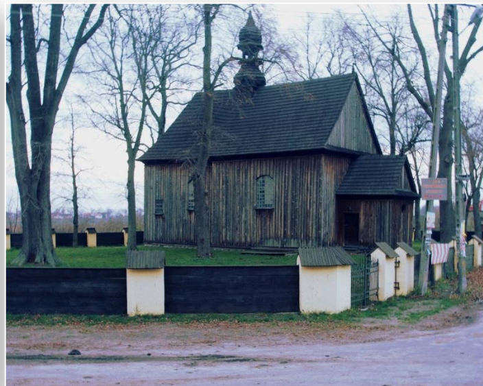
Zabytkowy kościół drewniany przy kolegiacie w Tumie