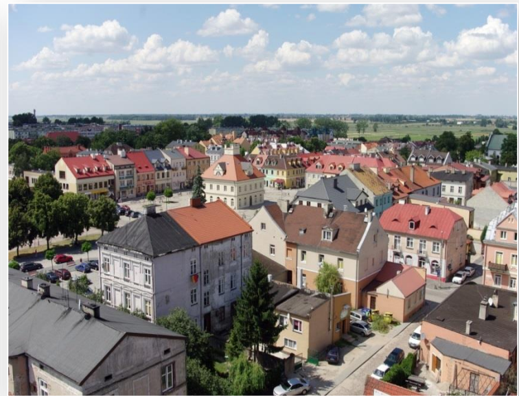
Widok miasta z wieży Zamku Łęczyckiego