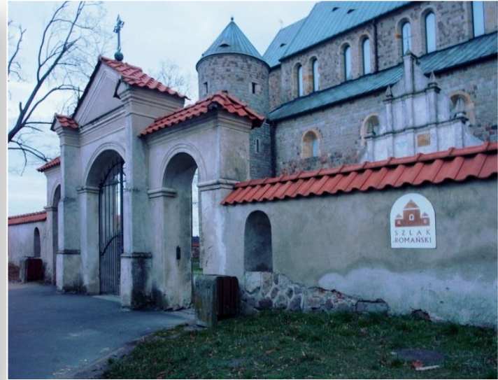
Kolegiata Tumska z XII wieku p.w. NMP i św. Aleksęgo