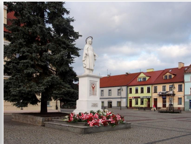
Rynek w Łęczycy z ratuszem i figura NMP