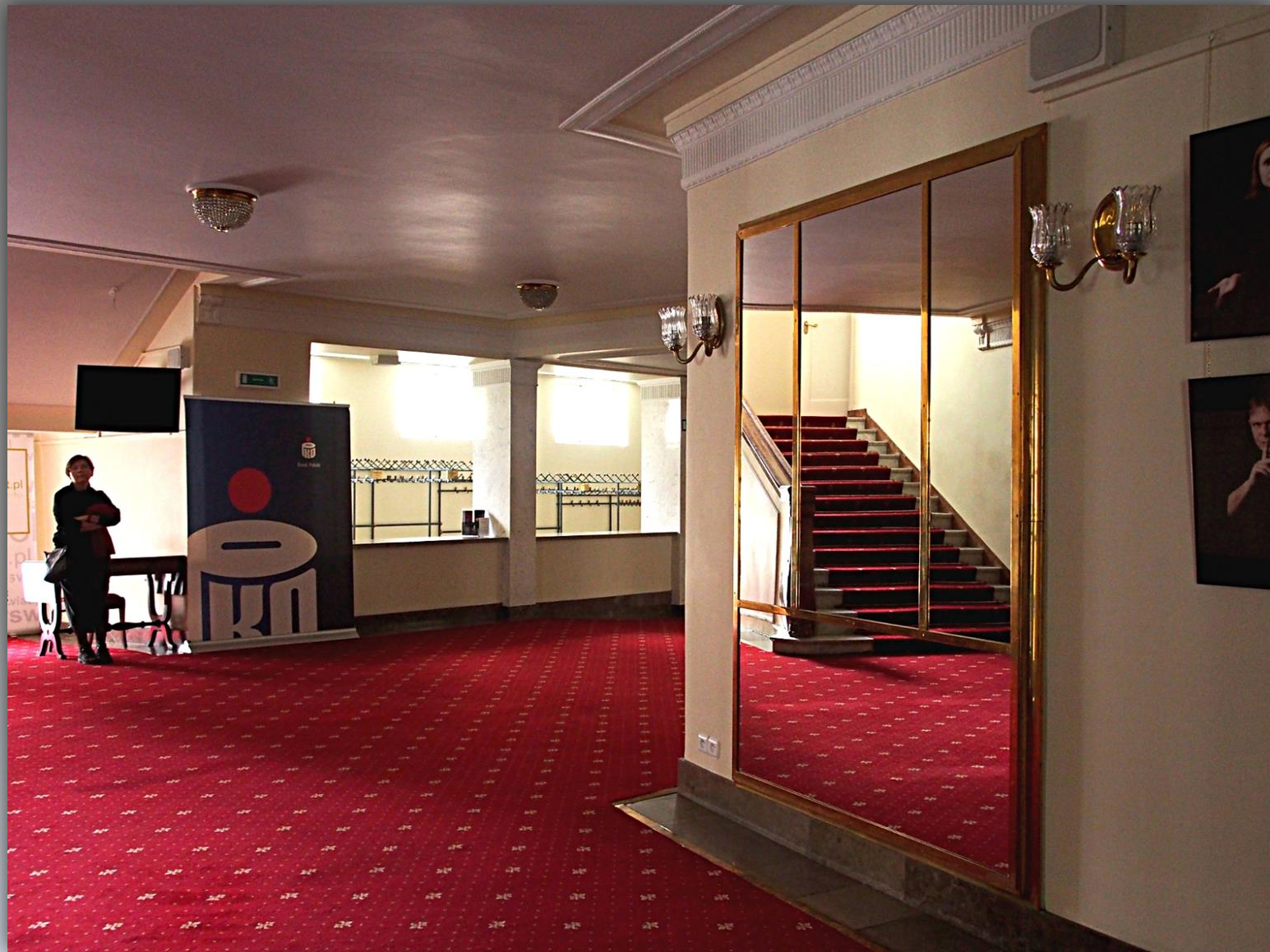
Teatr otwarto 29 stycznia 1913 r. z inicjatywy Arnolda Szyfmana