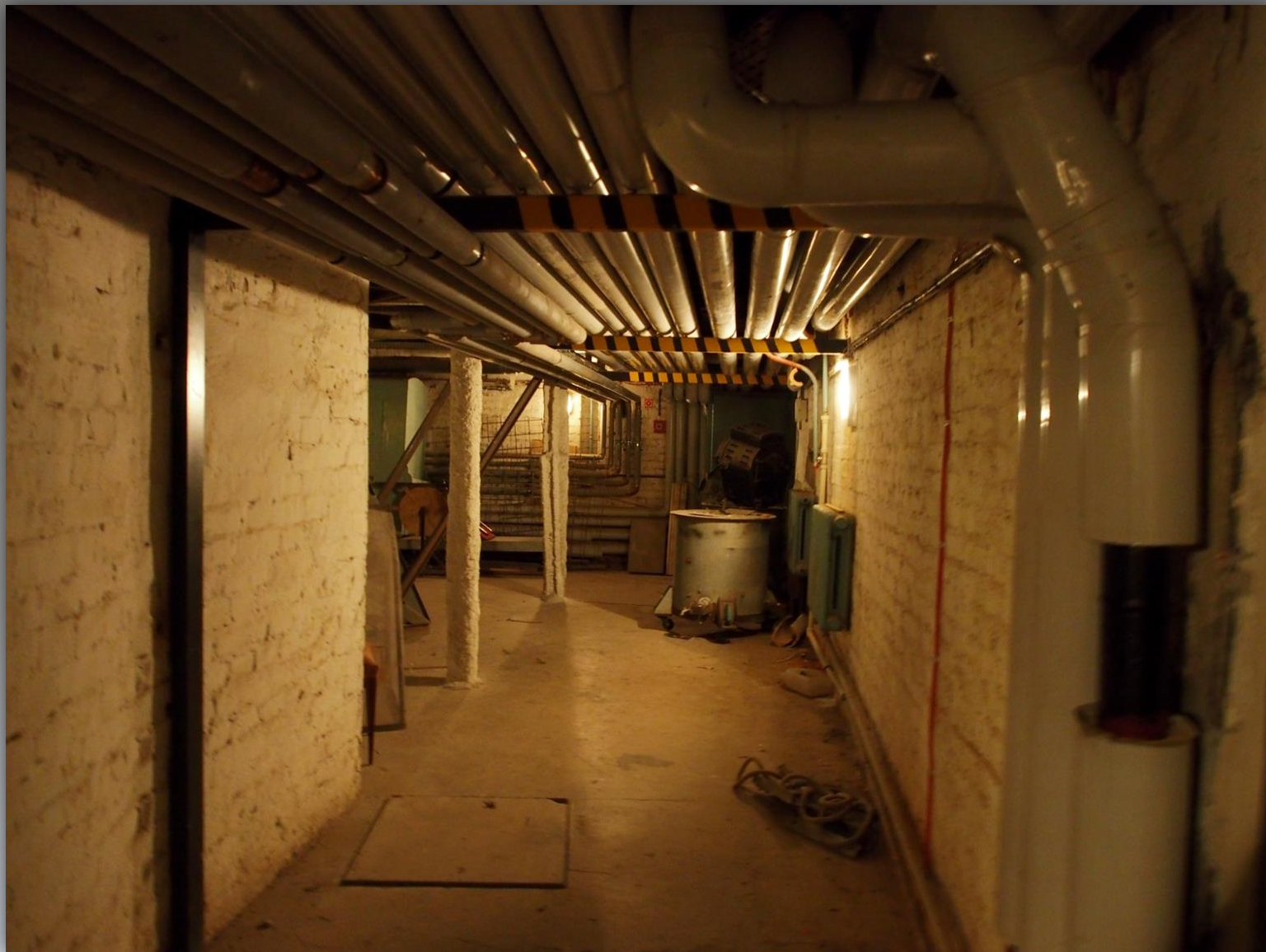
Korytarz w podziemiu teatru