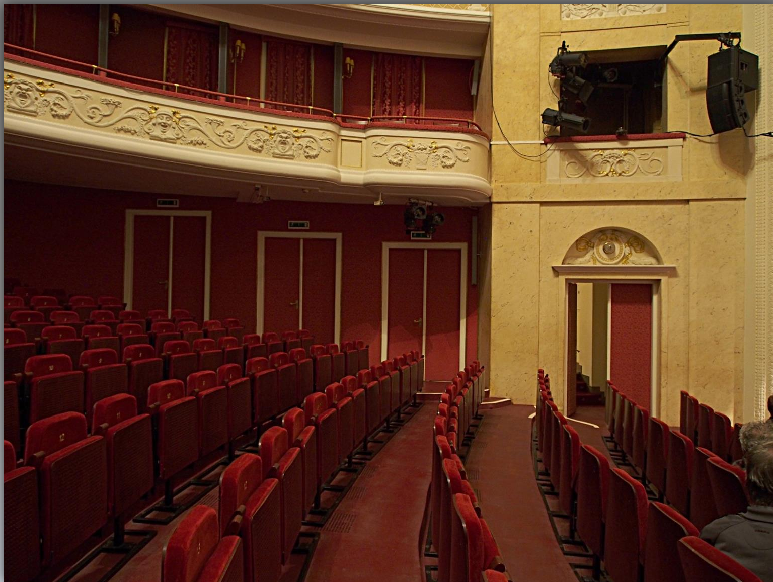
Widownia na parterze