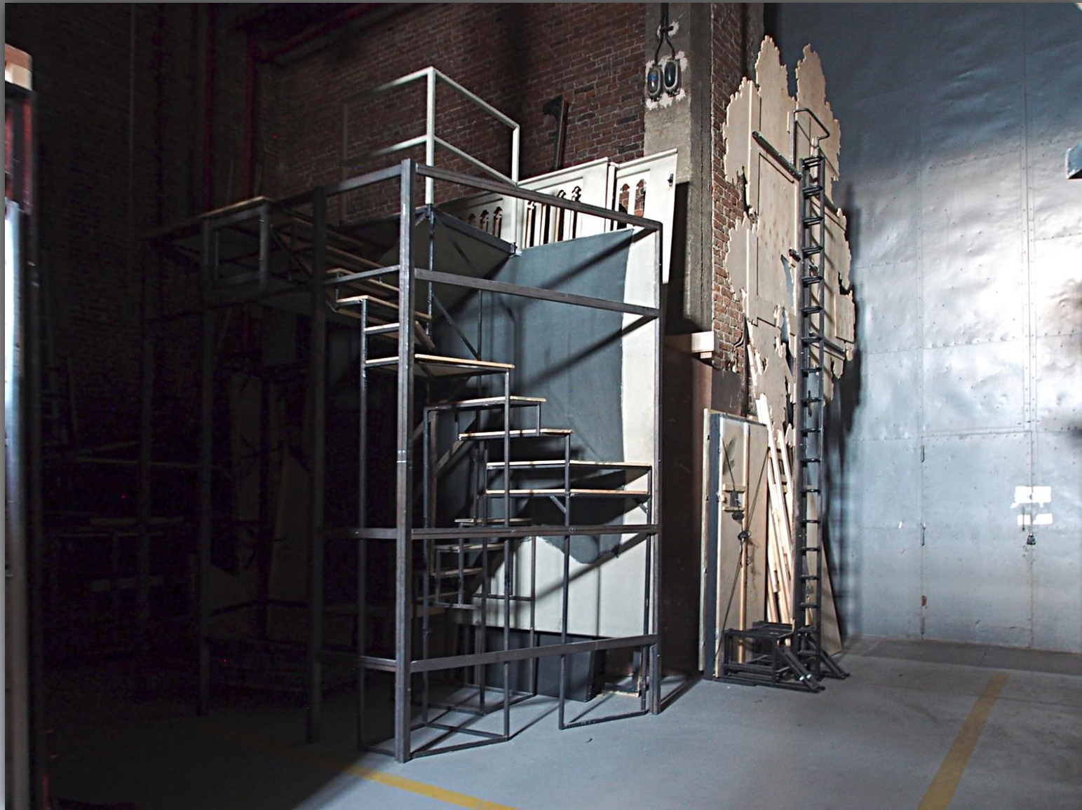
Fragment dekoracji w magazynie