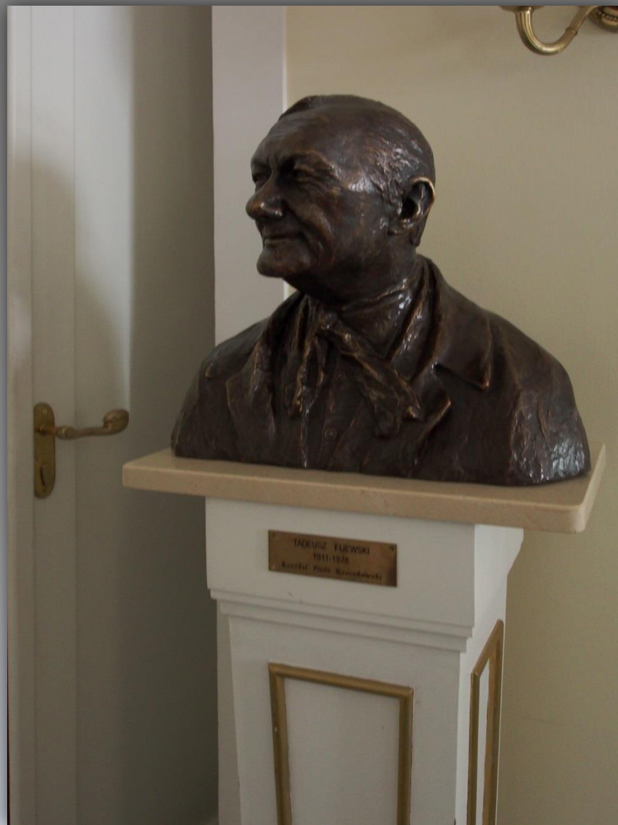
Popiersia Mariana Wyrzykowskiego i Tadeusza Fijewskiego