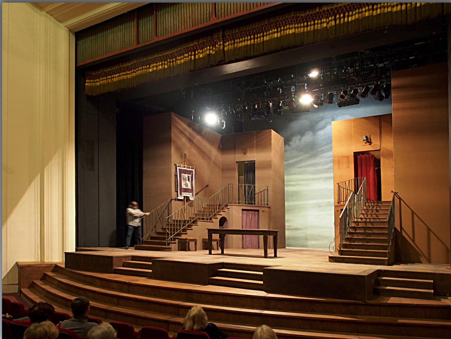
Przewodnik zapoznaje nas z przygotowywaniem dekoracji