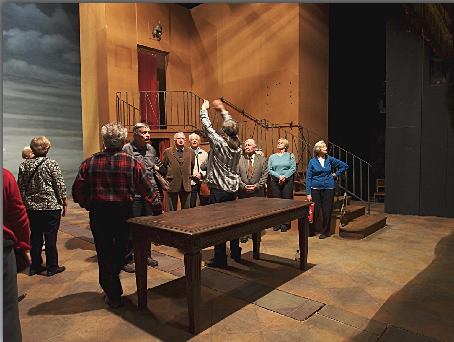
Przewodnik pokazuje, jak funkcjonuje opuszczanie kurtyny