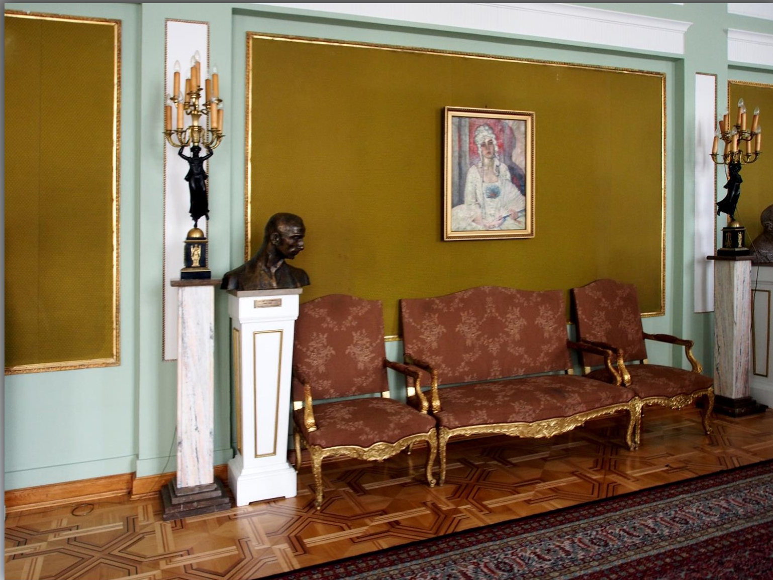
Wnętrze Sali Reprezentacyjnej