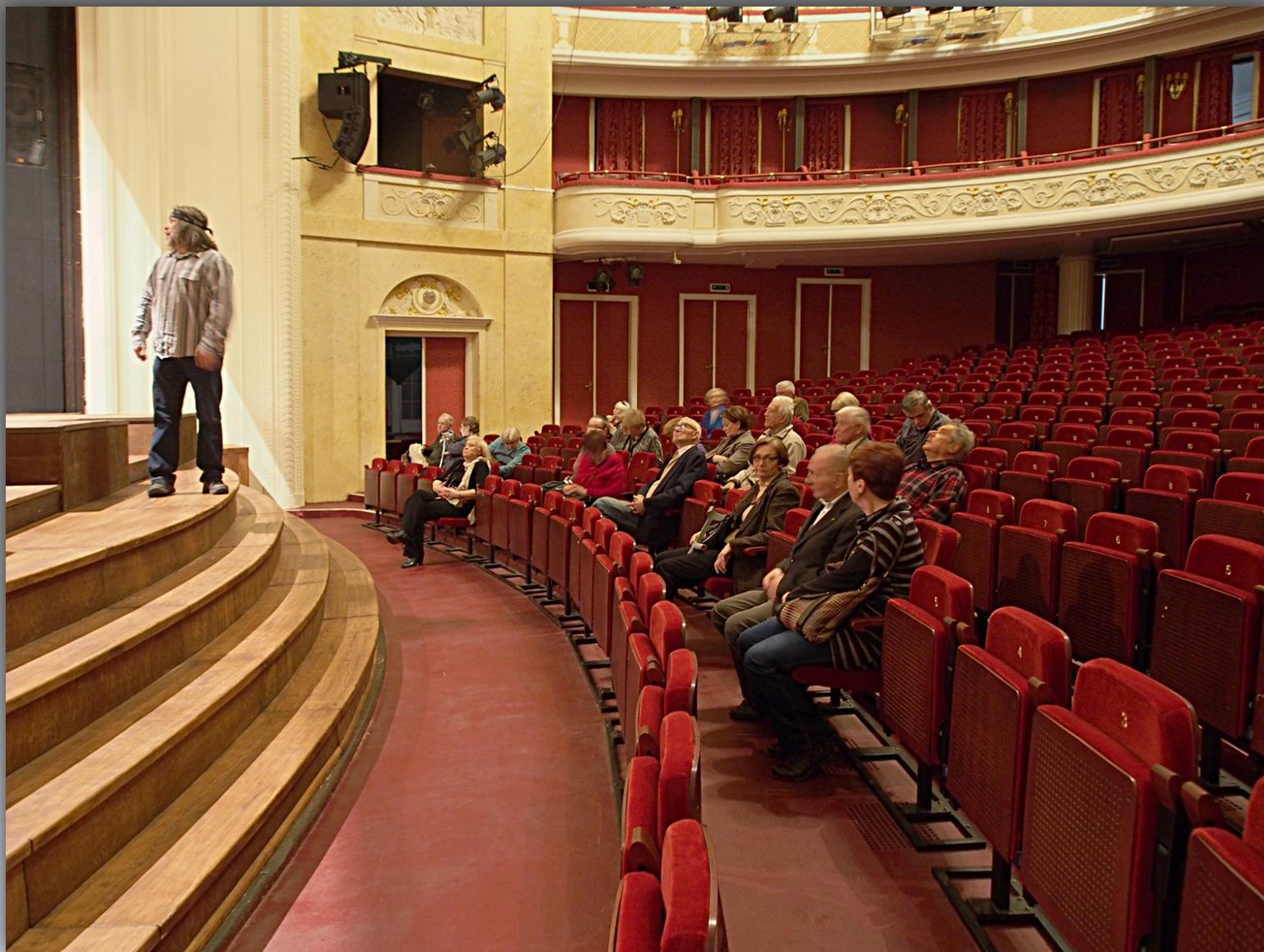
Przewodnik teatralny i uczestnicy wycieczki