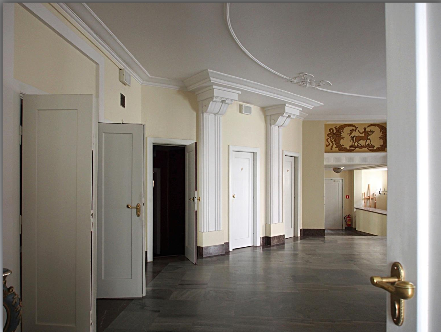
Korytarz do loży dla gości honorowych