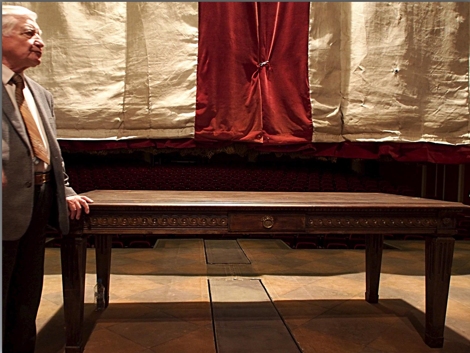
Kurtyna opuszczona, widziana od strony sceny