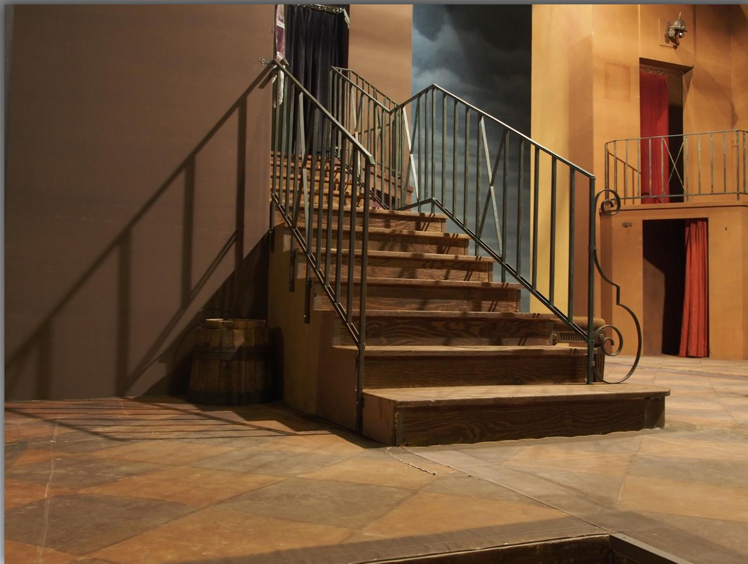
Dekoracje do sztuki „Zemsta” A. Fredry