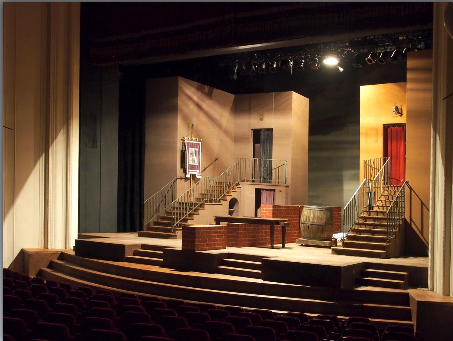
Scena przygotowana do spektaklu „Zemsta”