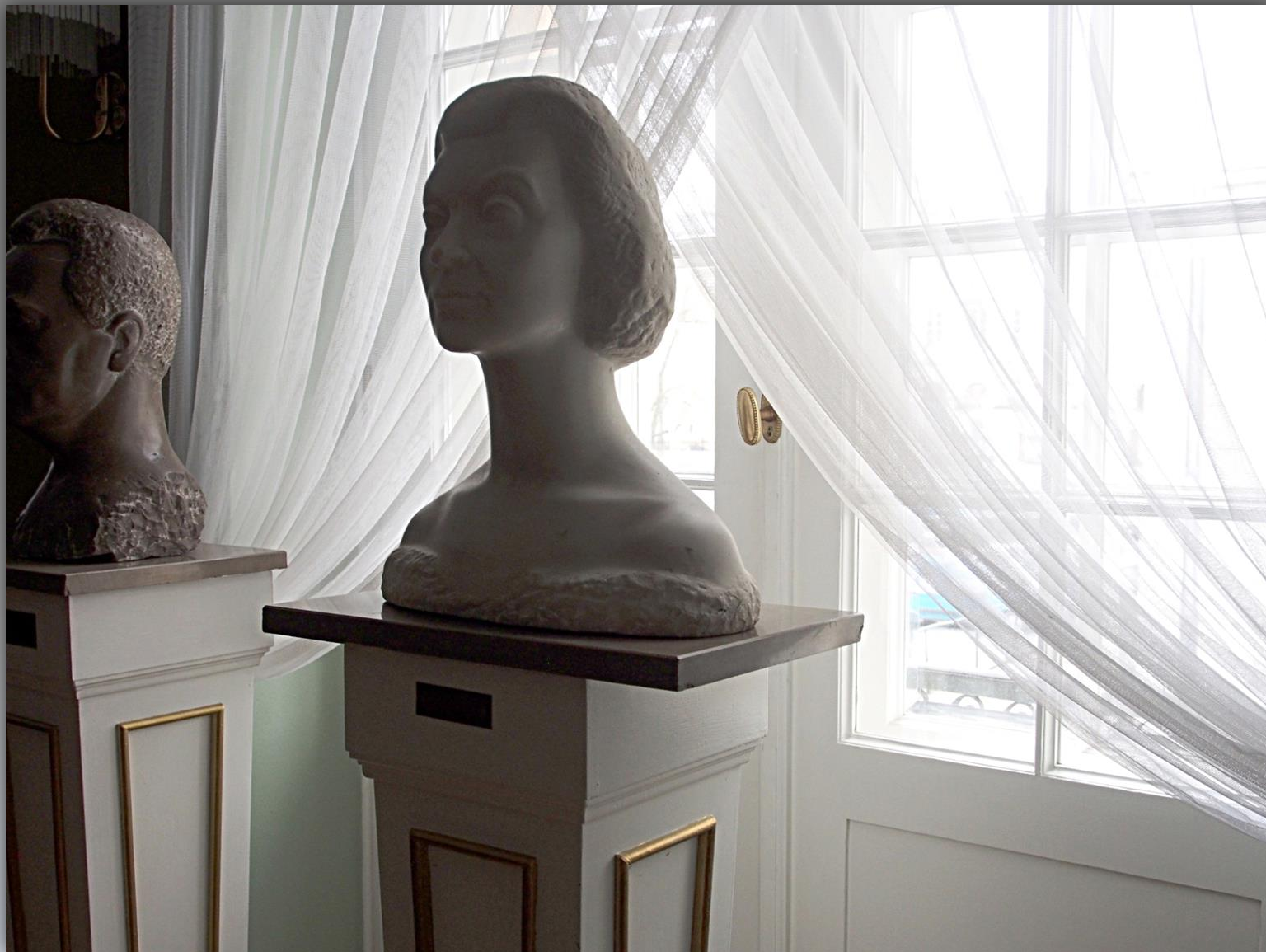
Popiersie Niny Andrycz