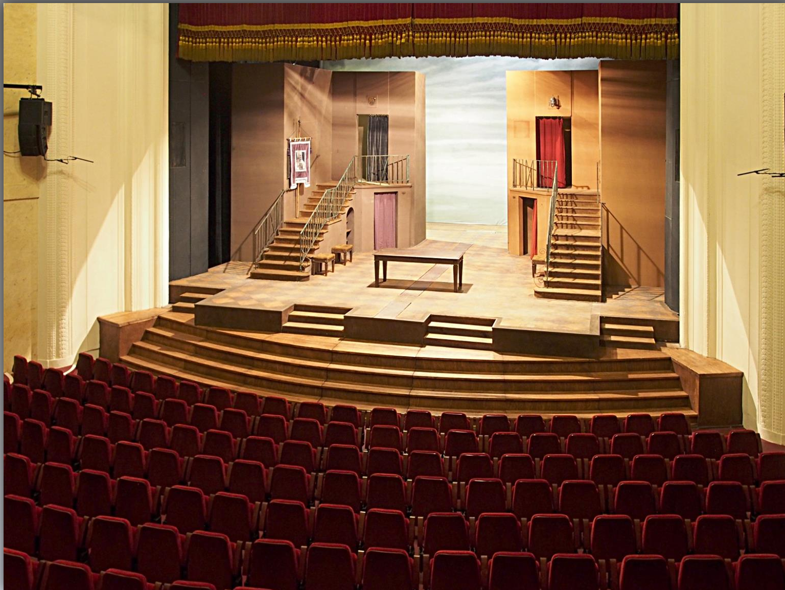
Scena, przygotowanie dekoracji do spektaklu