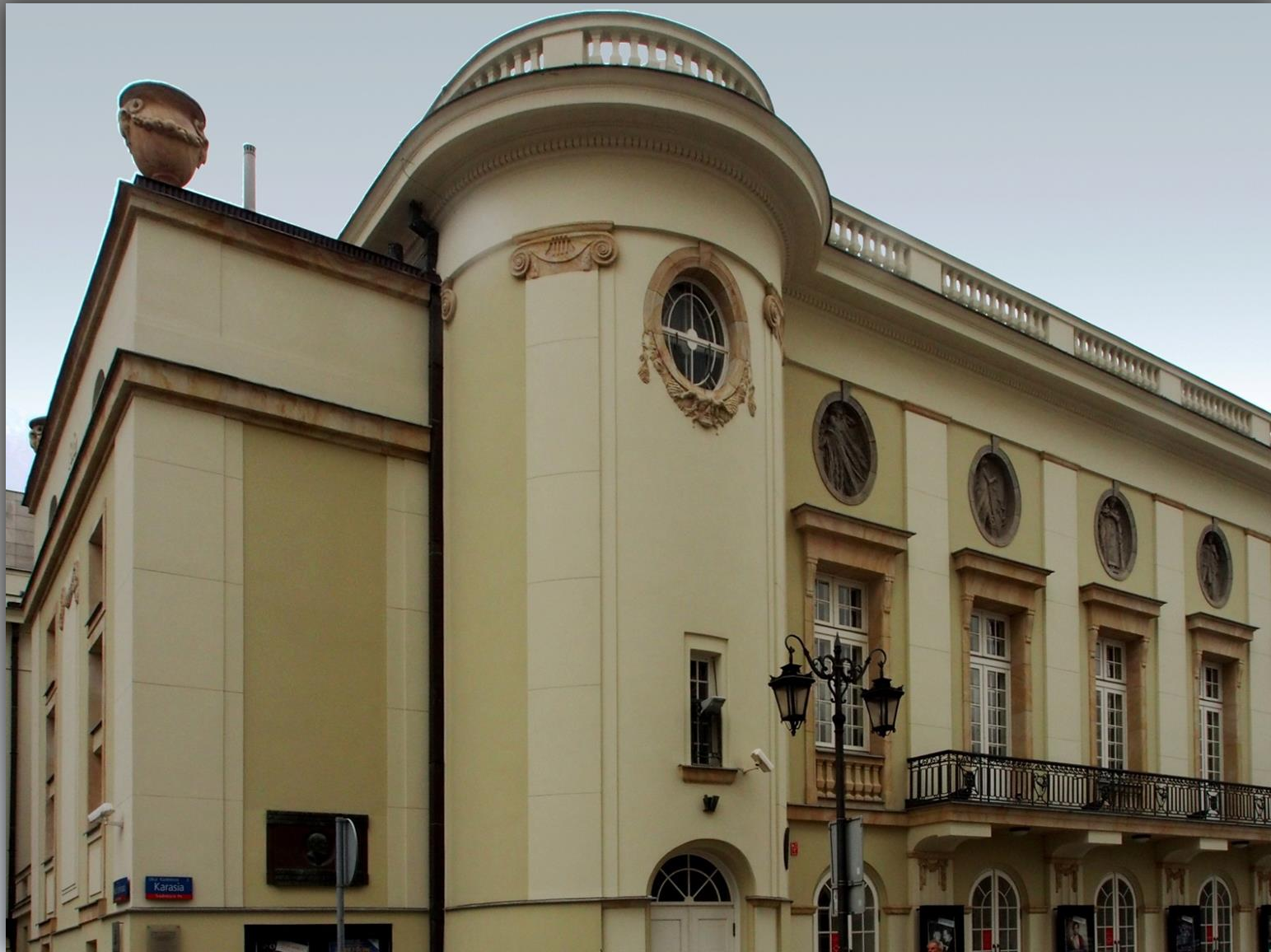
Teatr Polski im. Arnolda Szyfmana w Warszawie