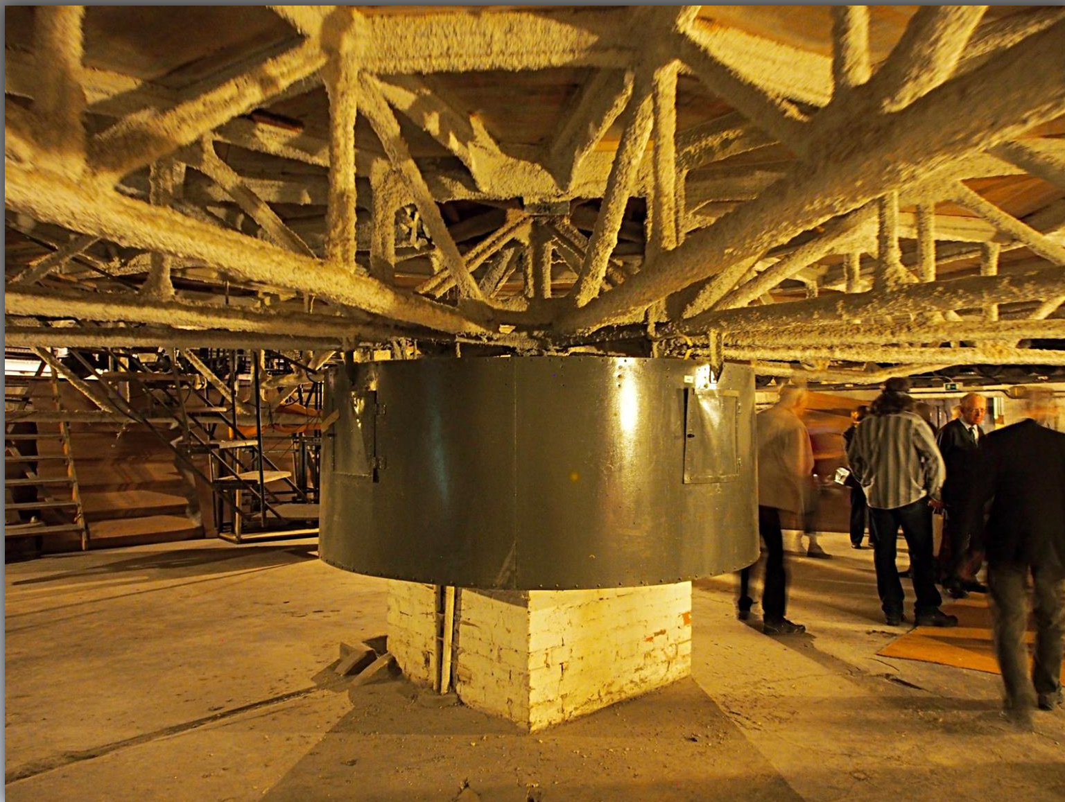
Mechanizm obracania sceny