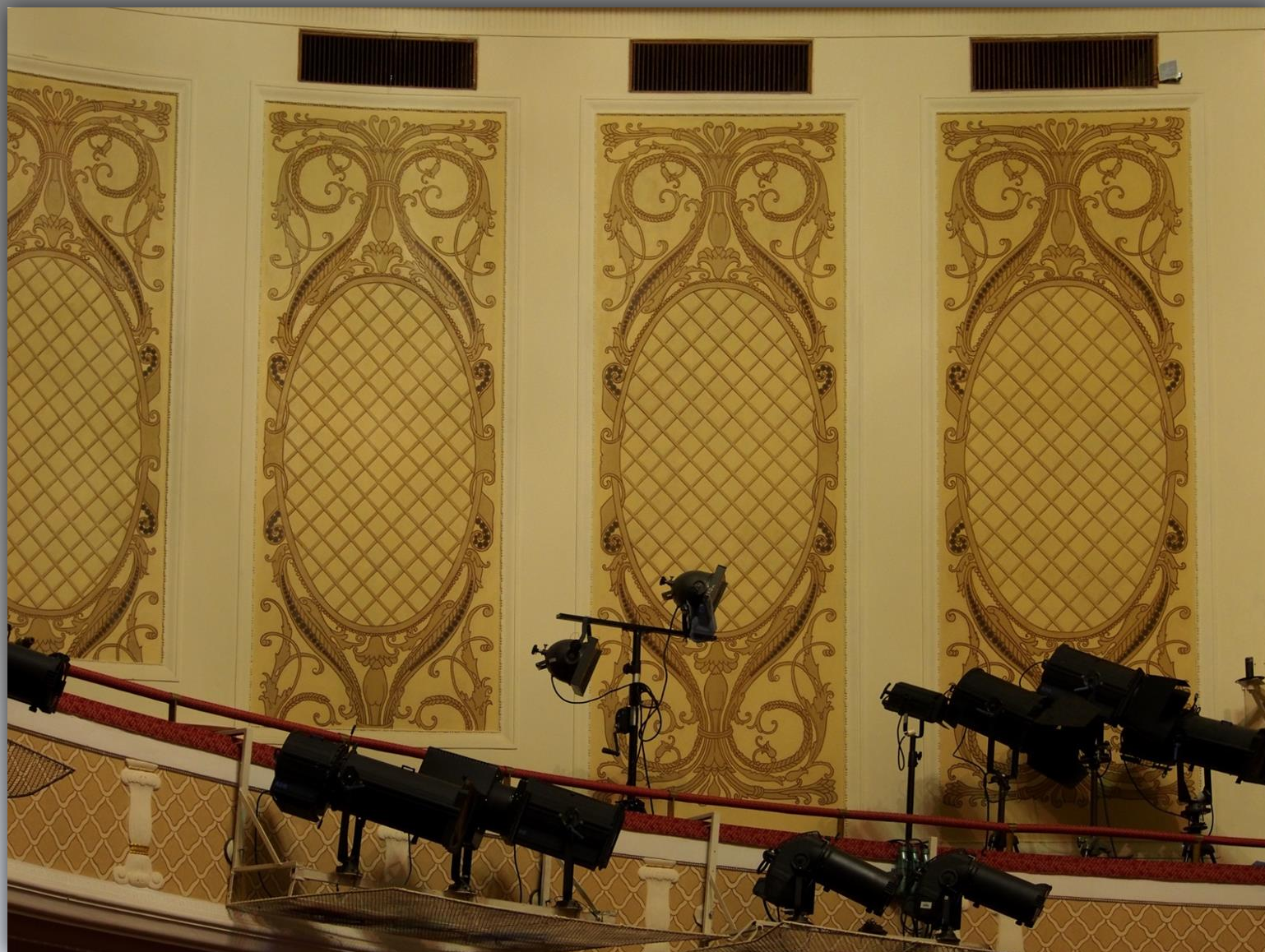
Sztukaterie ściennie i reflektory oświetleniowe