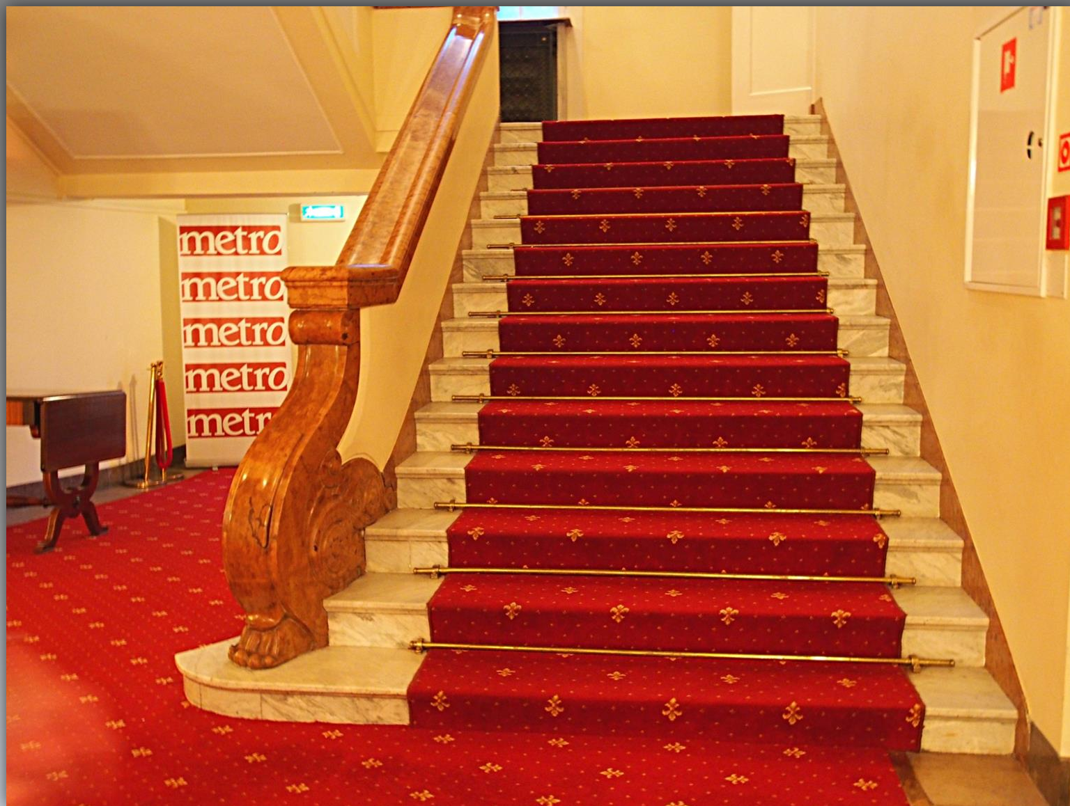
Schody na piętro do Salí Reprezentacyjnej i balkonów