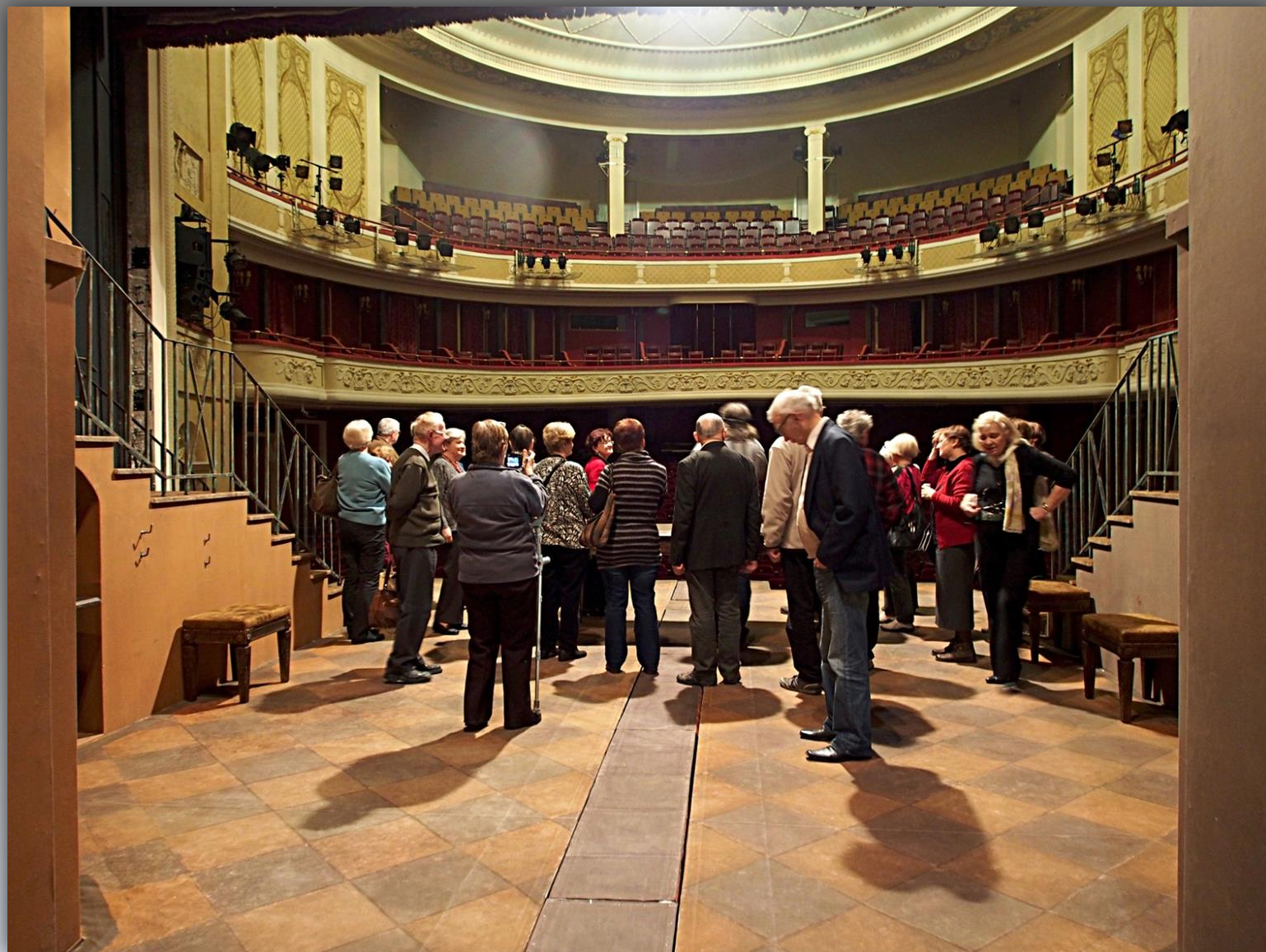
Scena od strony zaplecza