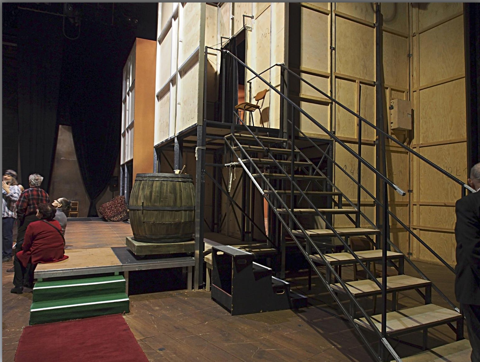
Dekoracje na zapleczu przygotowane do zmiany