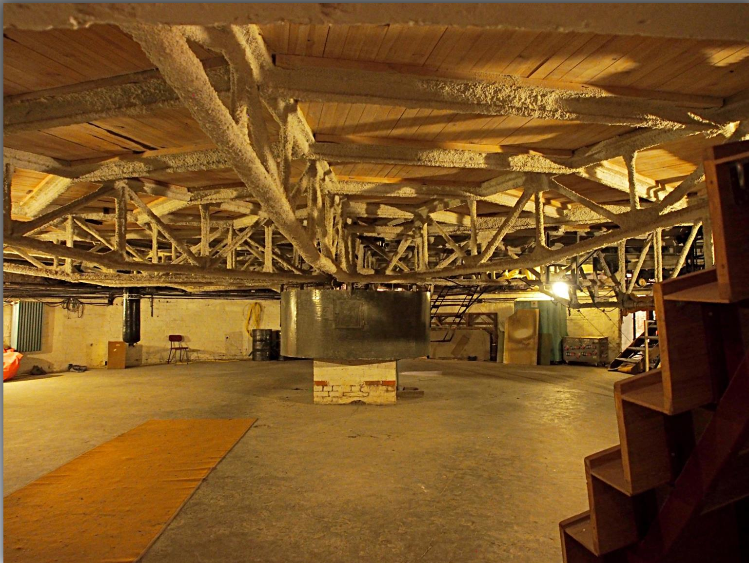
Pomieszczenie techniczne sceny