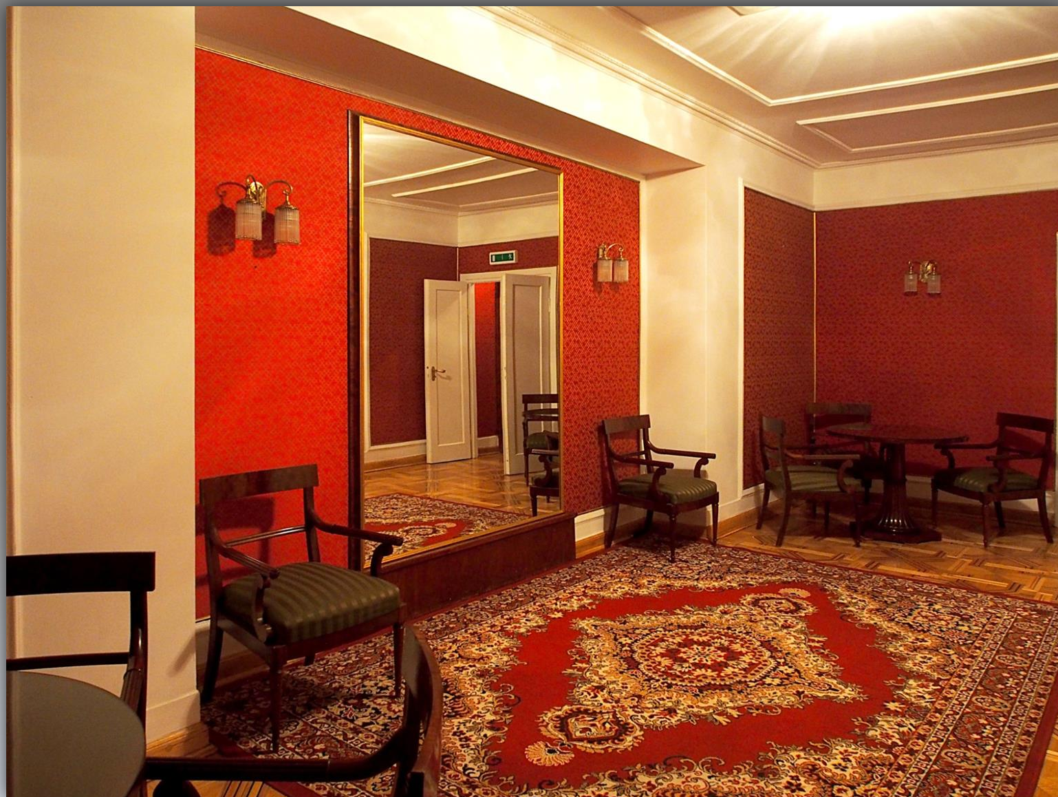
Salonik przy łóży dla gości honorowych