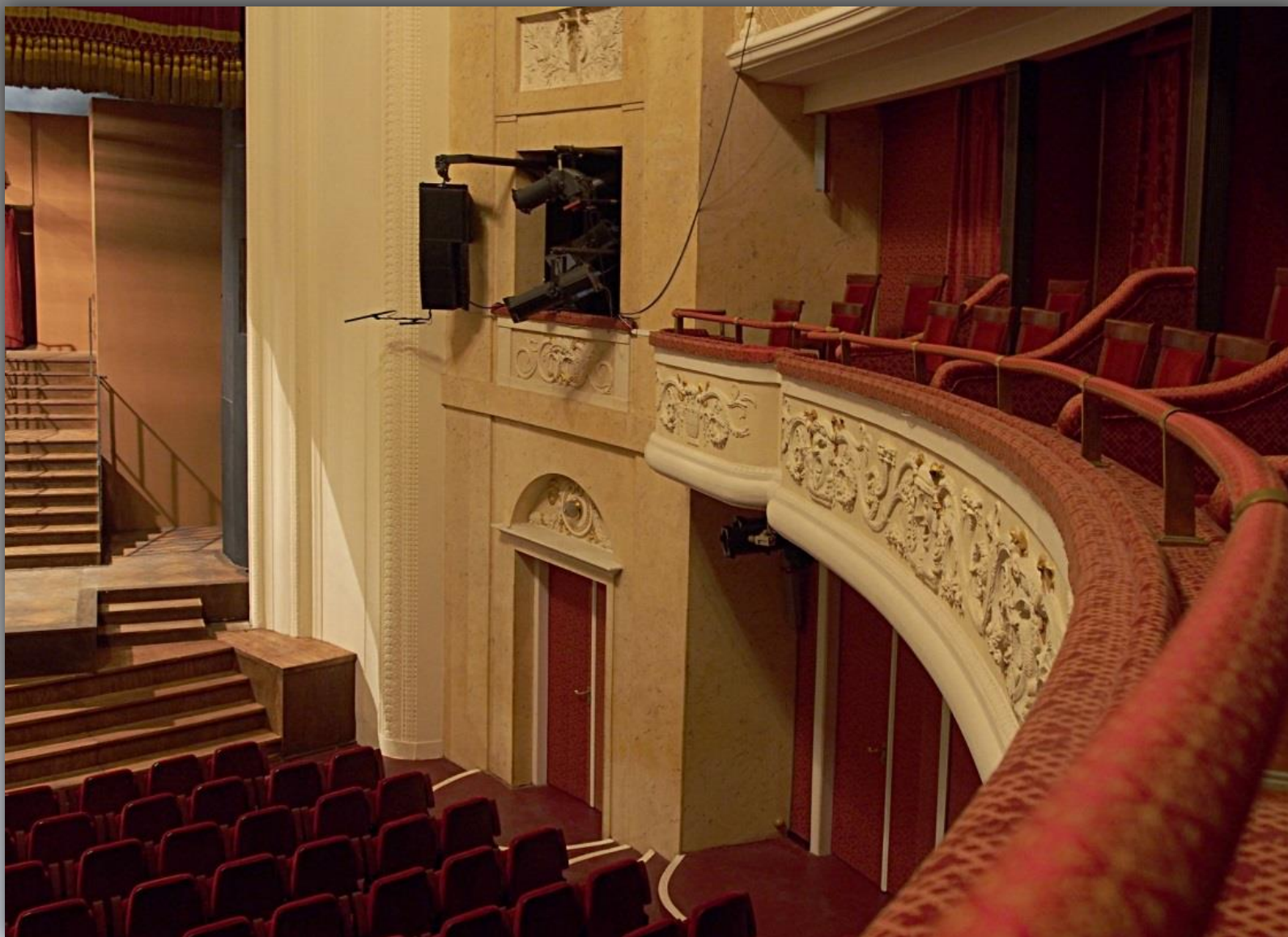
Widok z balkonu