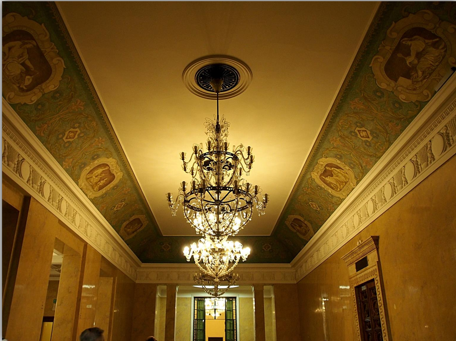
Korytarz z dekoracjami przedstawiającymi ludzi różnych zawodów