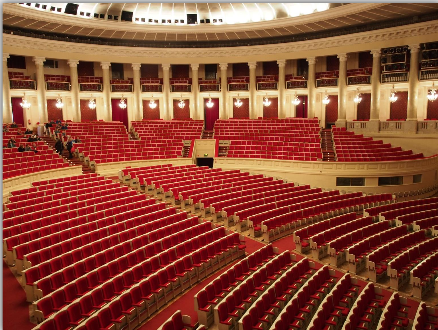
Widownia w Sali Kongresowej