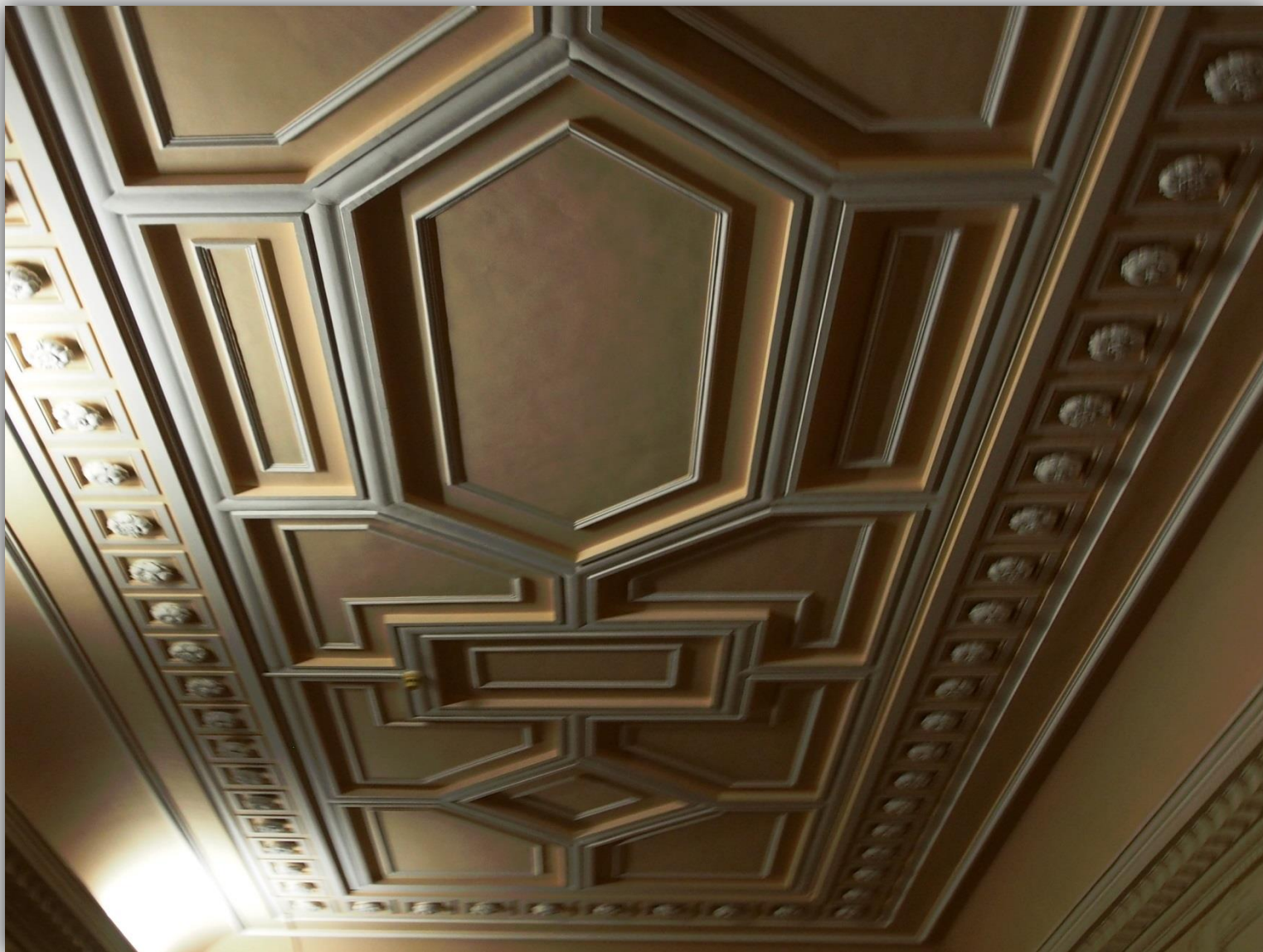
Fragment sufitu w korytarzu