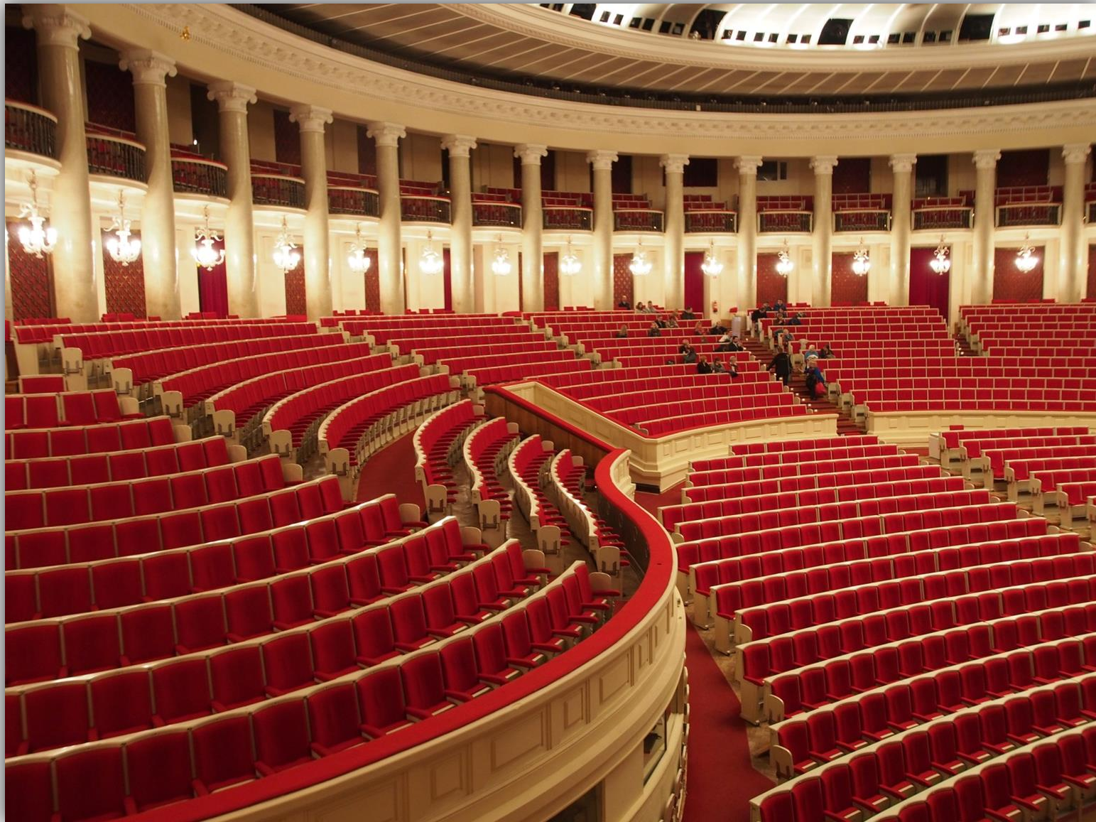
Amfiteatr, balkony i parter