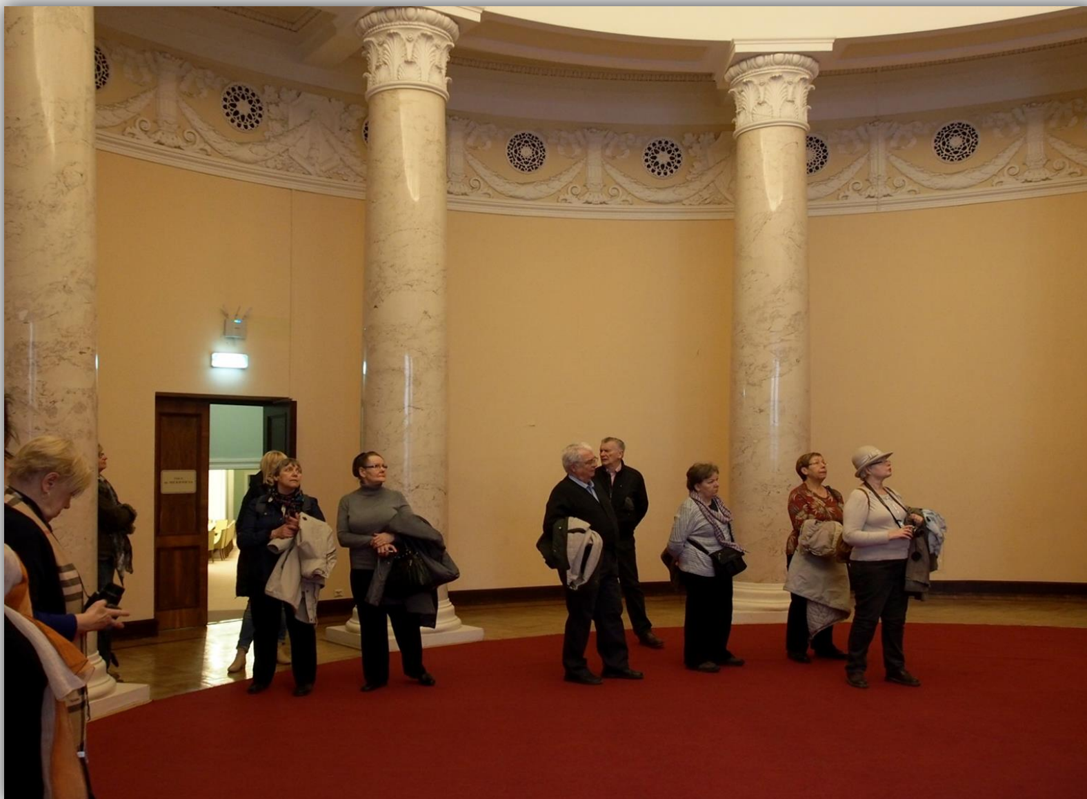
Zwiedzamy salę kolumnową im. Mikołaja Kopernika