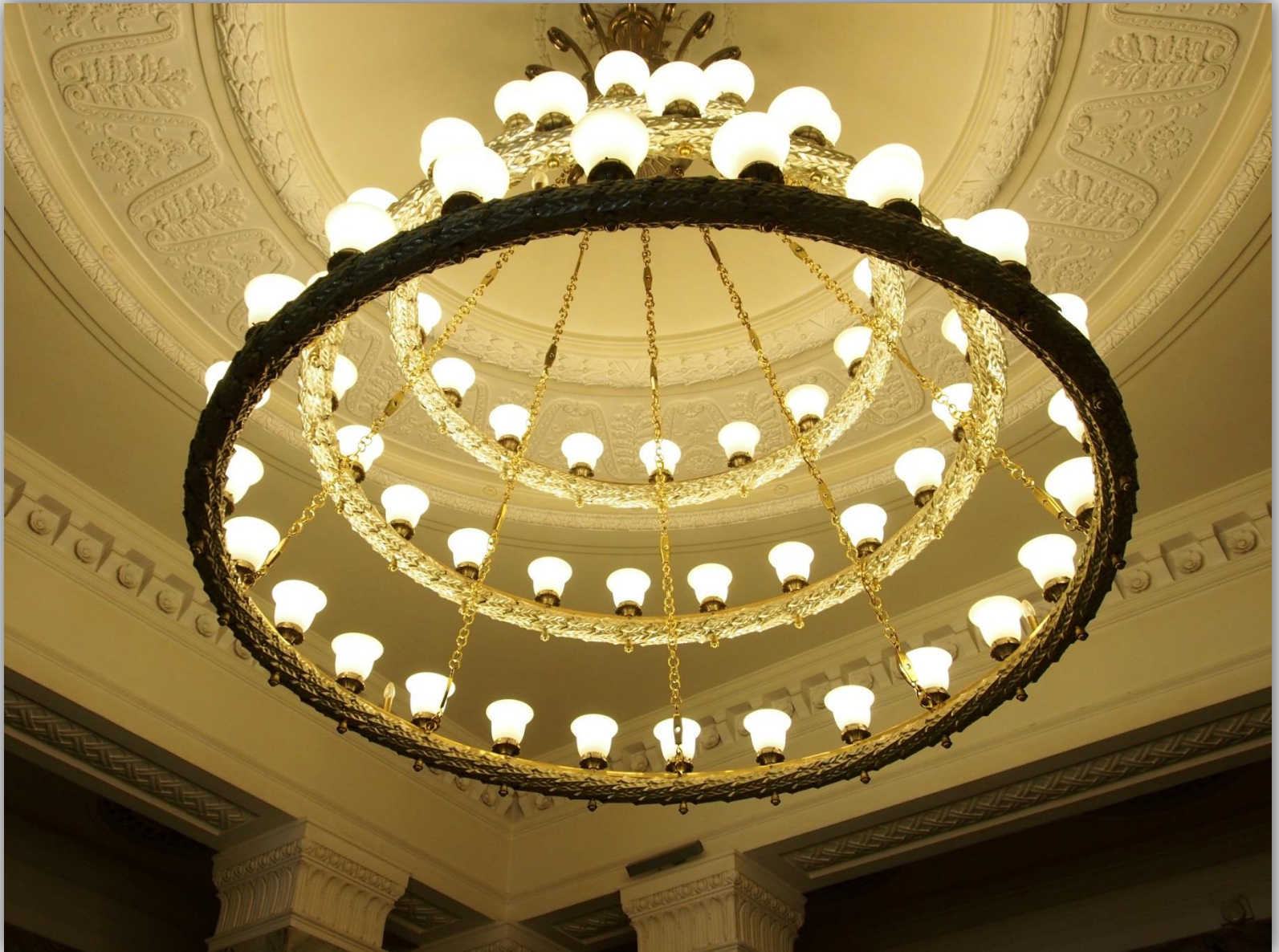
Żyrandol w Sali Marmurowej