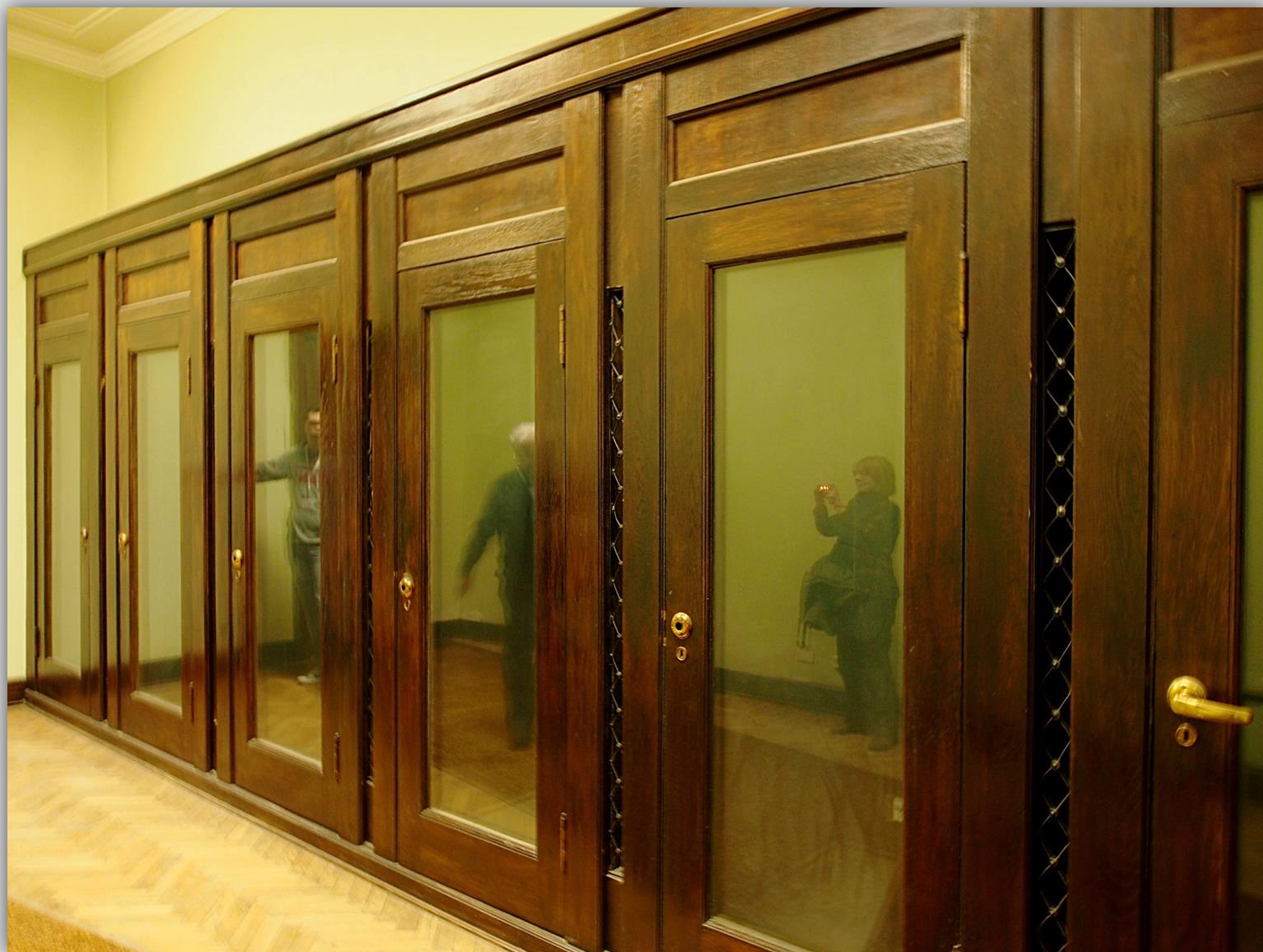
Kabiny dla tłumaczy w Sali Konferencyjnej