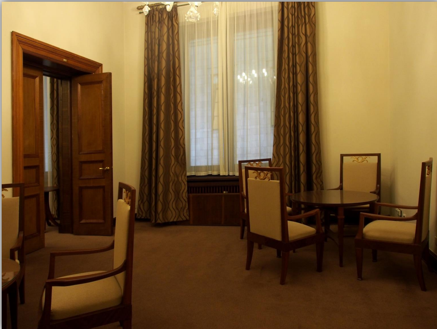
Salonik dla gości honorowych