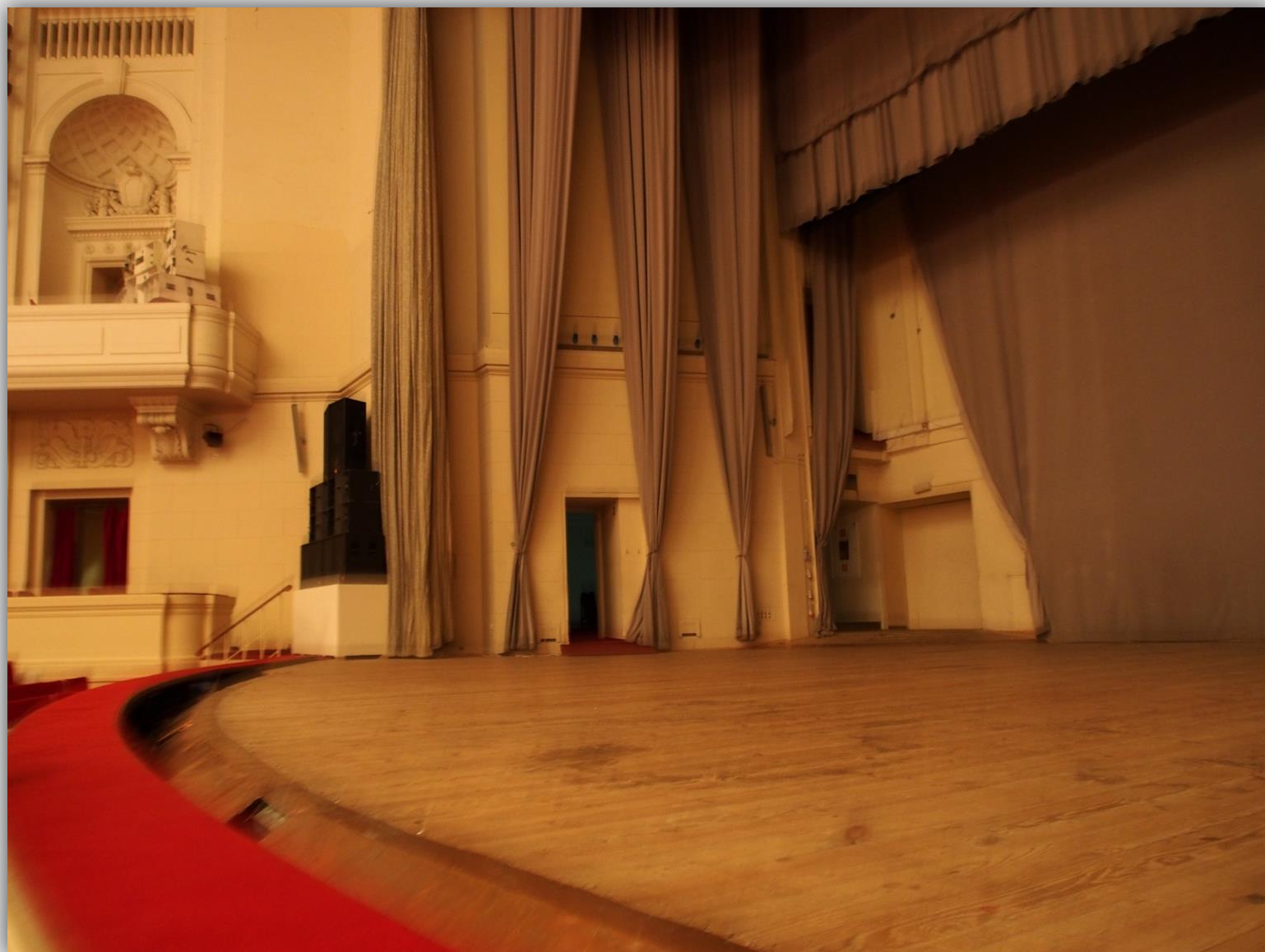
Scena widziana z balkonu dla gości honorowych