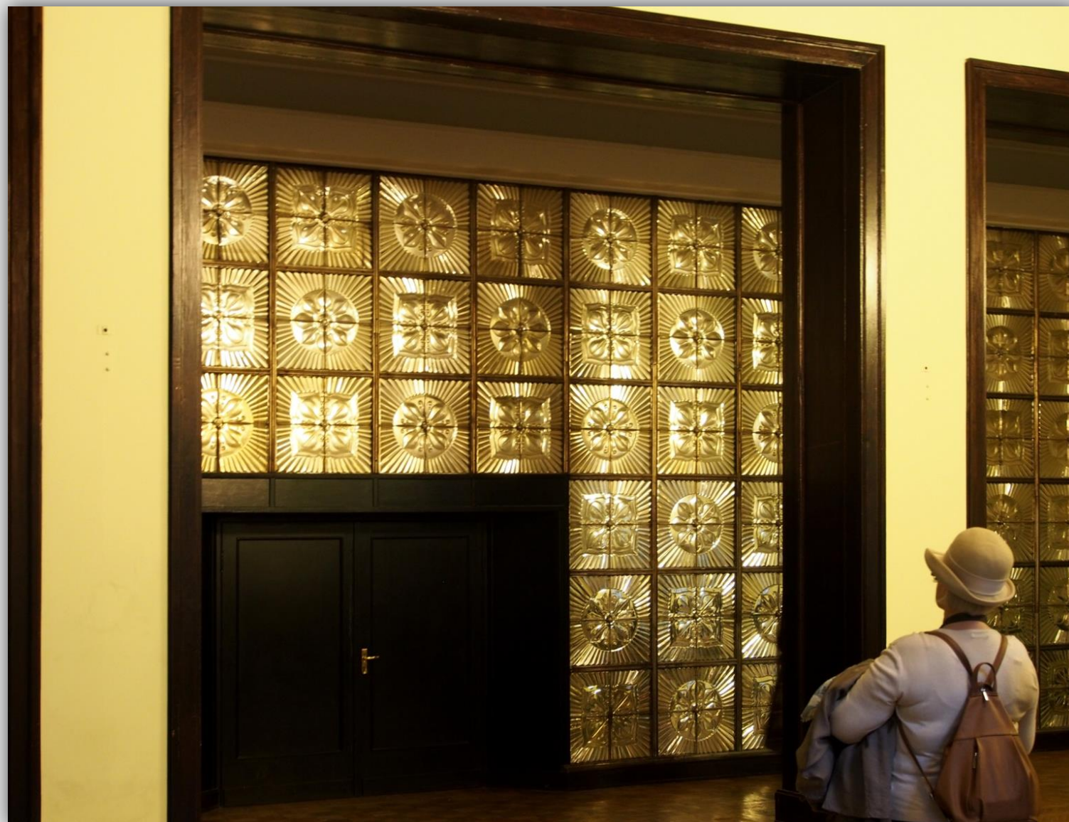
Uczestniczka wycieczki ogląda dekorację ściany