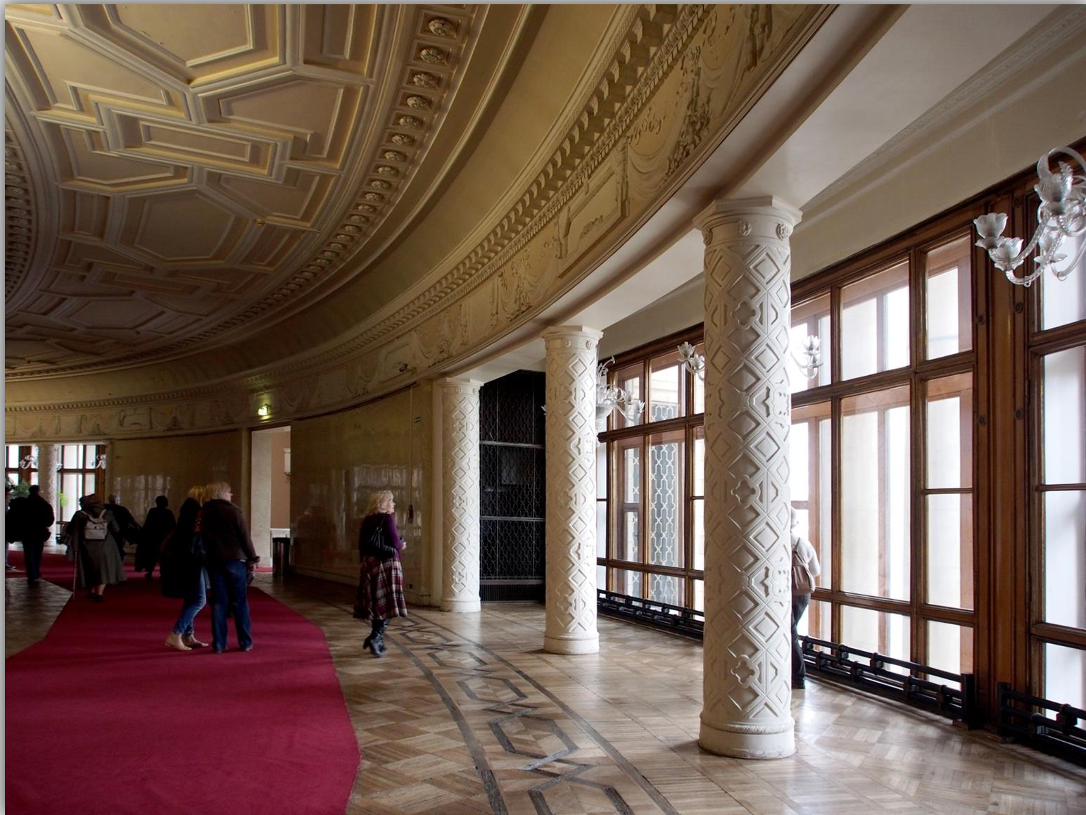
Kolumny w korytarzu do Sali Kongresowej