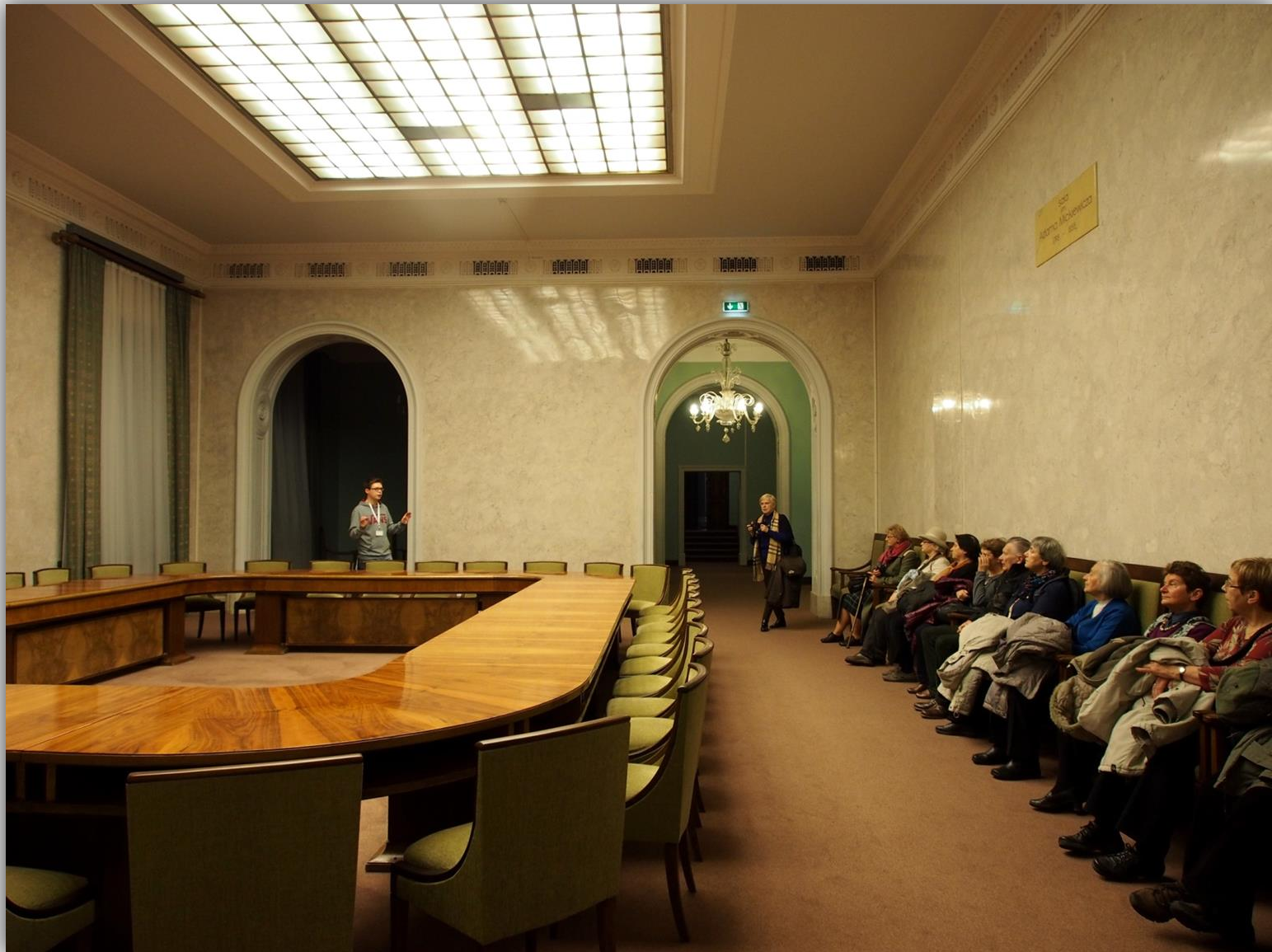
Sala obrad im. Adama Mickiewicza