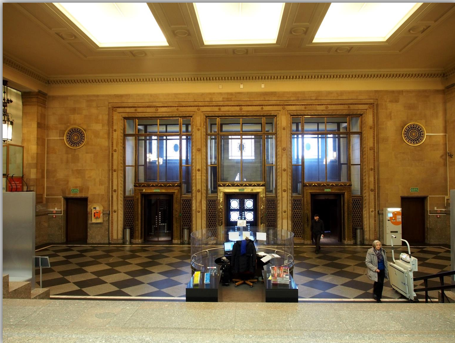
Wejście główne i recepcja Pałacu Kultury i Nauki