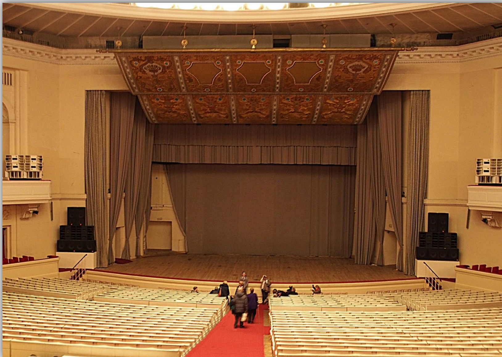
Sala Kongresowa widziana od wejścia na piętrze