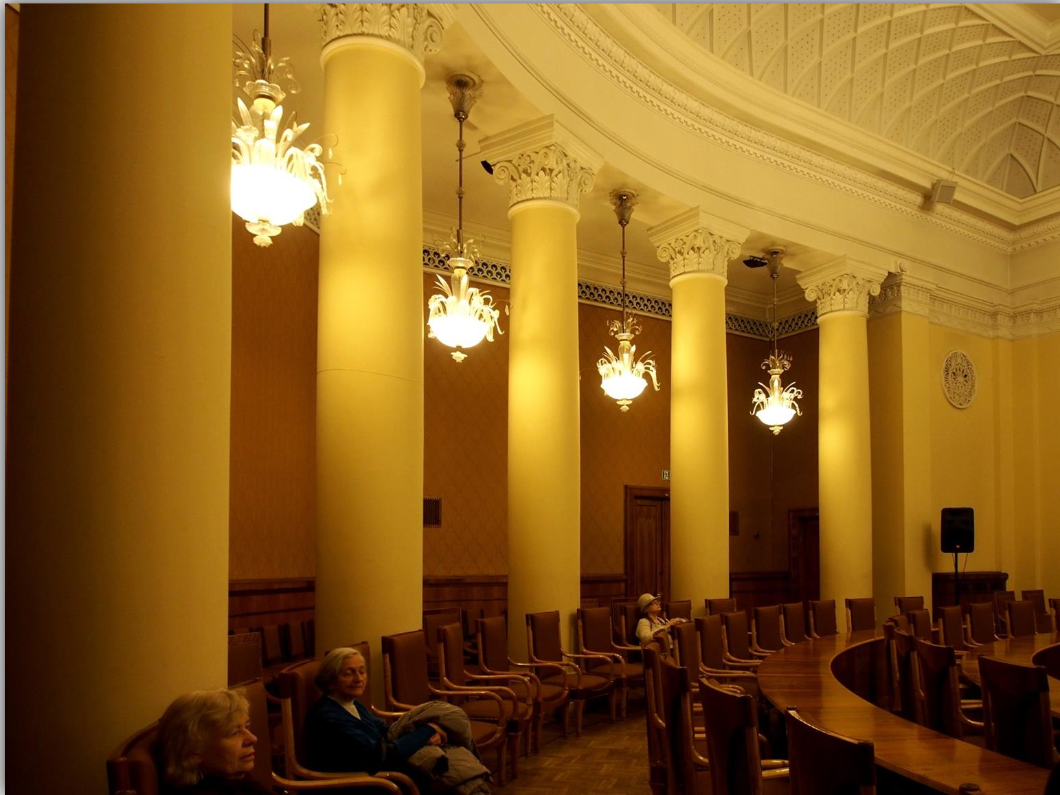
Saka konferencyjna z okrągłym stołem do obrad