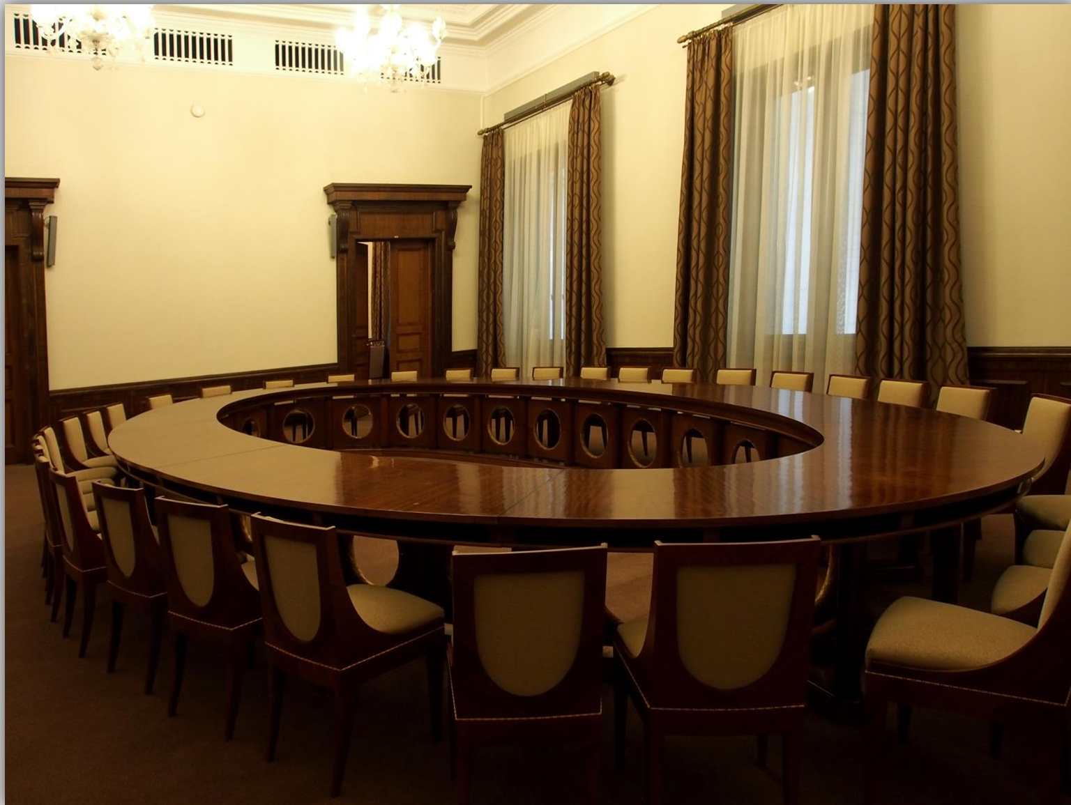
Sala przyjęć dla gości honorowych