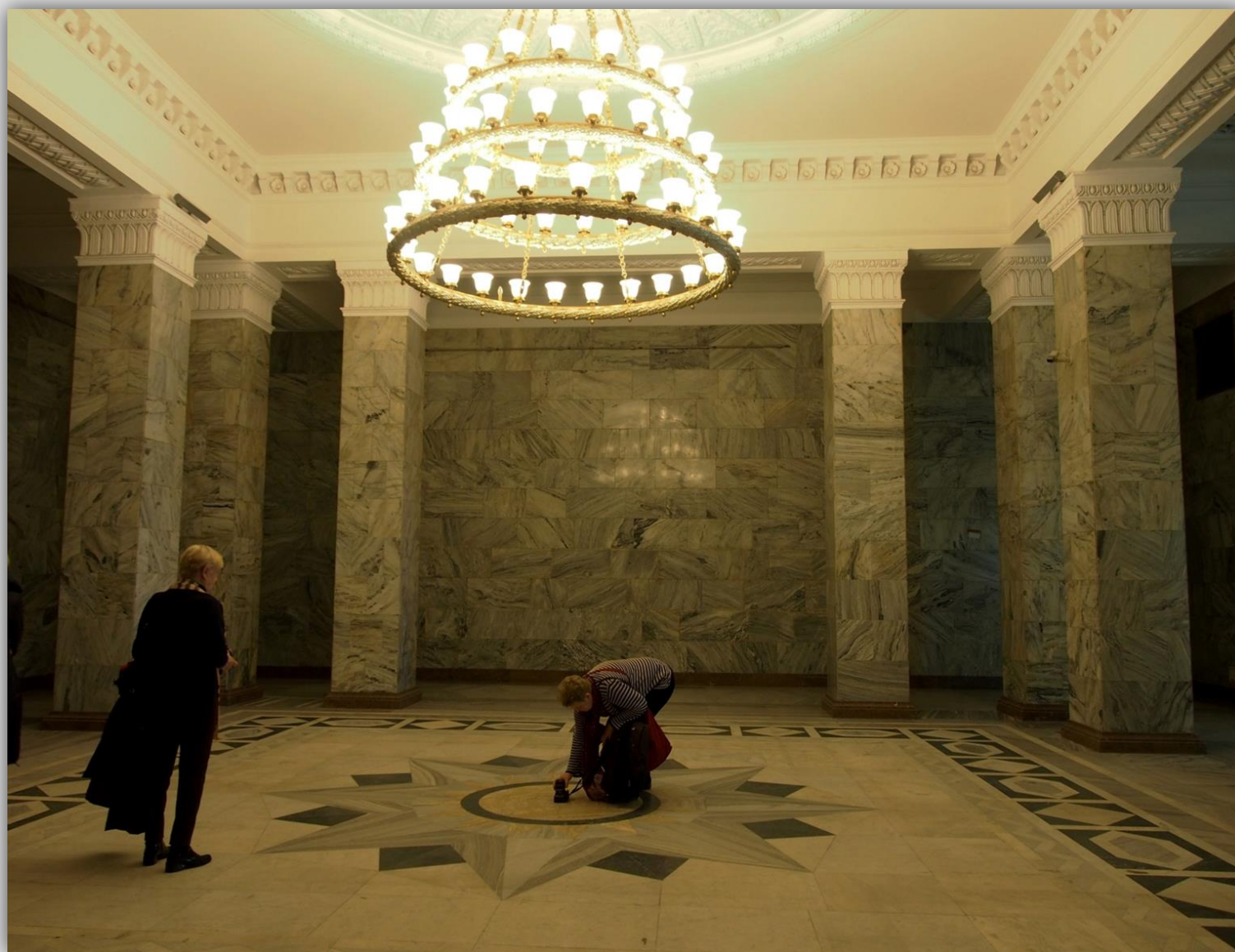
Oglądamy piękny żyrandol i posadzkę Sali Marmurowej