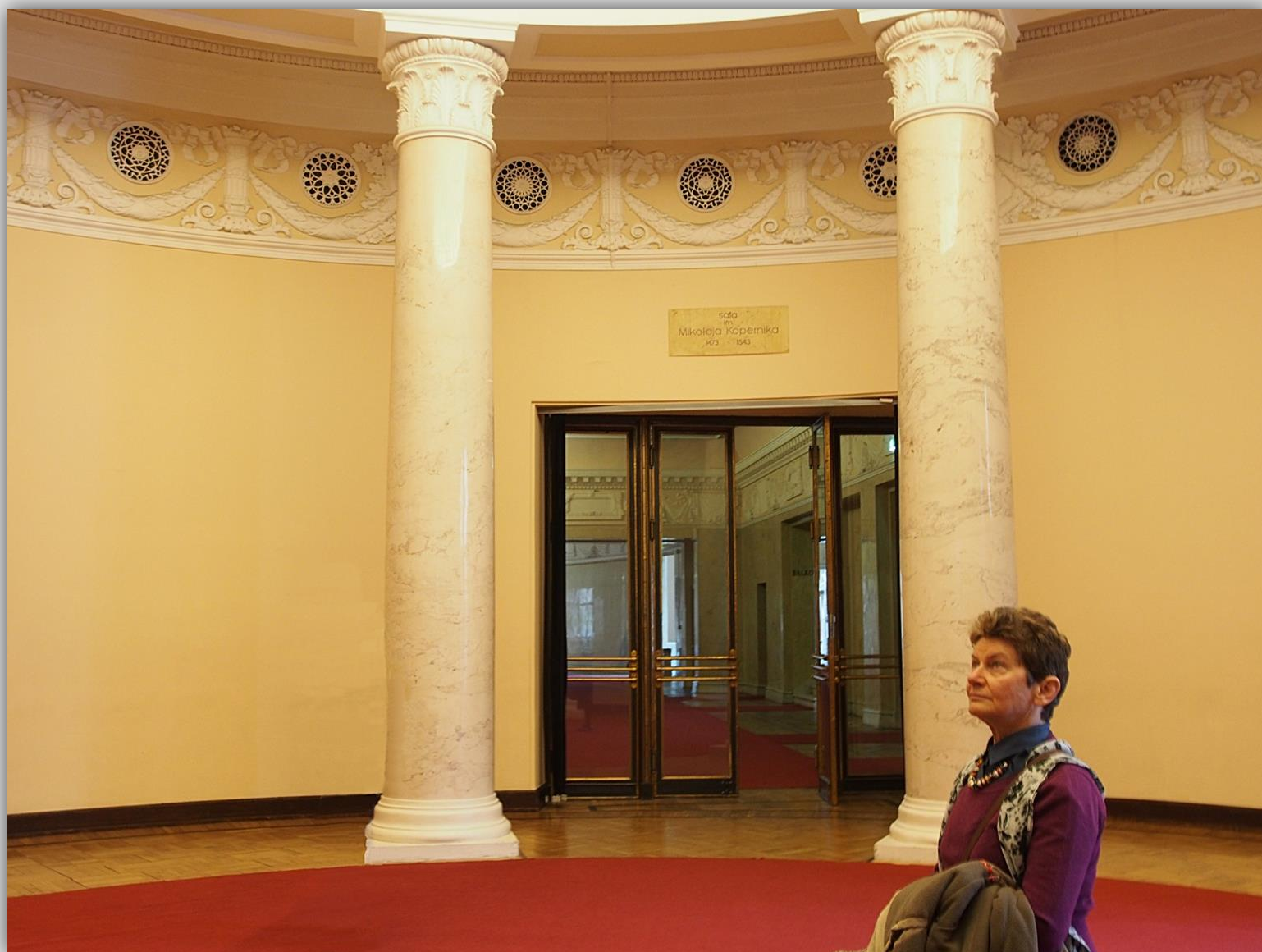
Kolumny w sali im. Mikołaja Kopernika