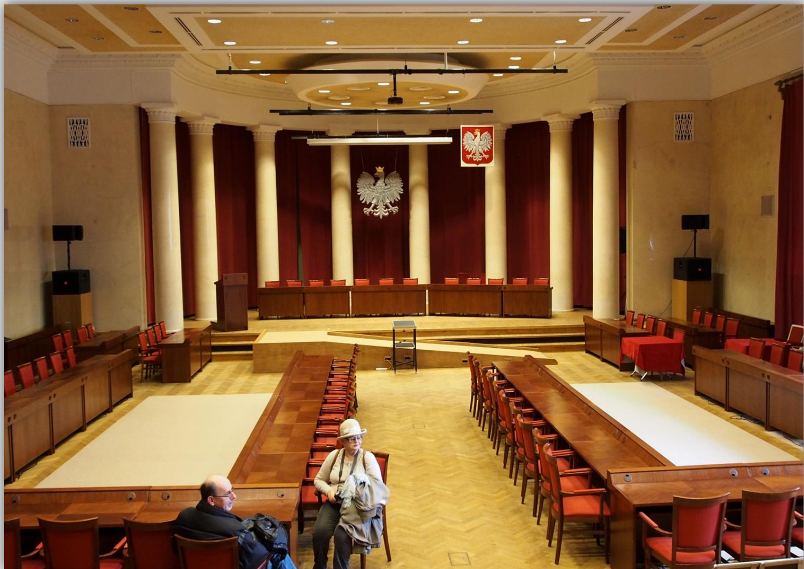
Sala obrad Rady Warszawy