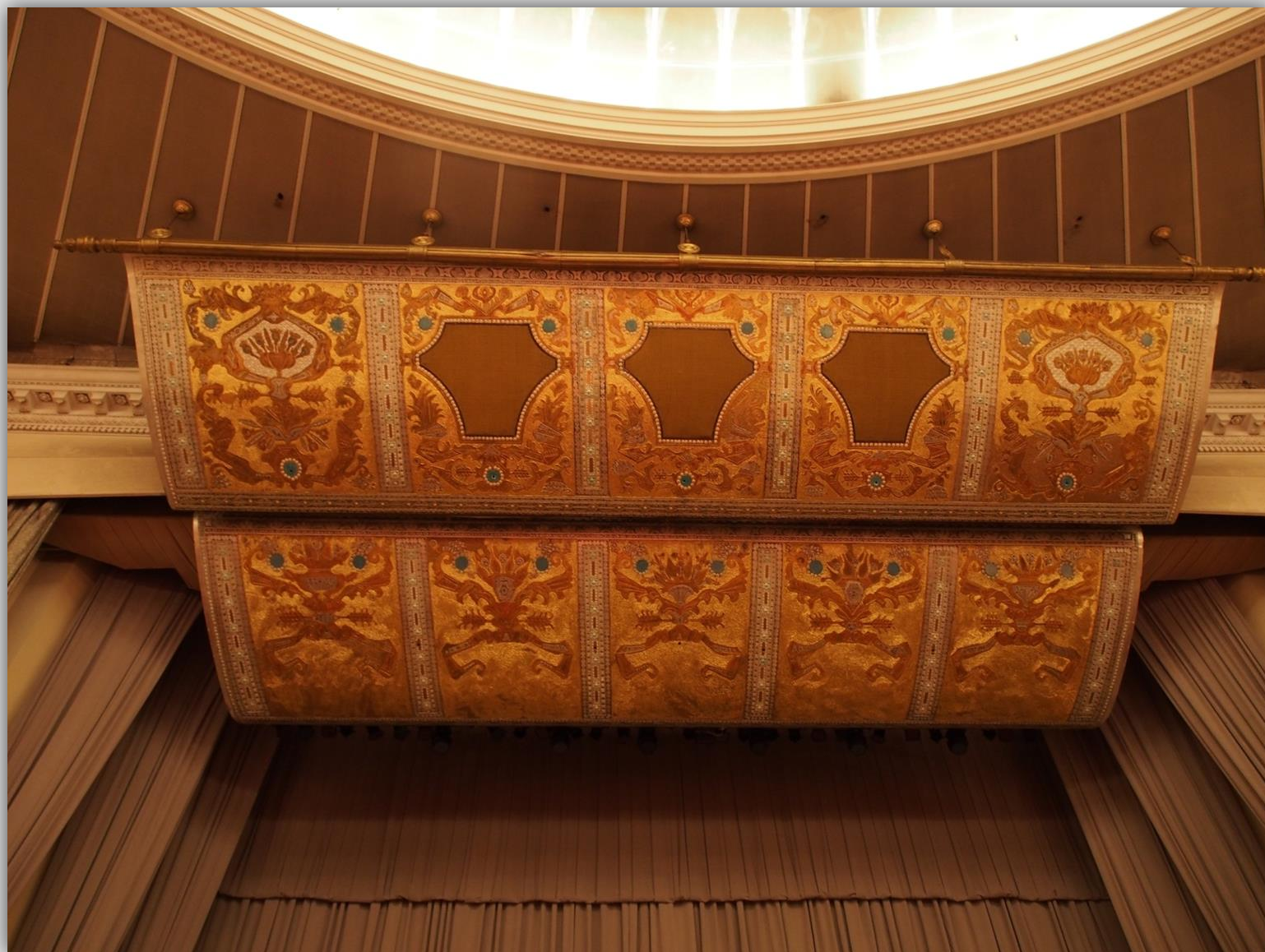
Ozdobny baldachim nad sceną