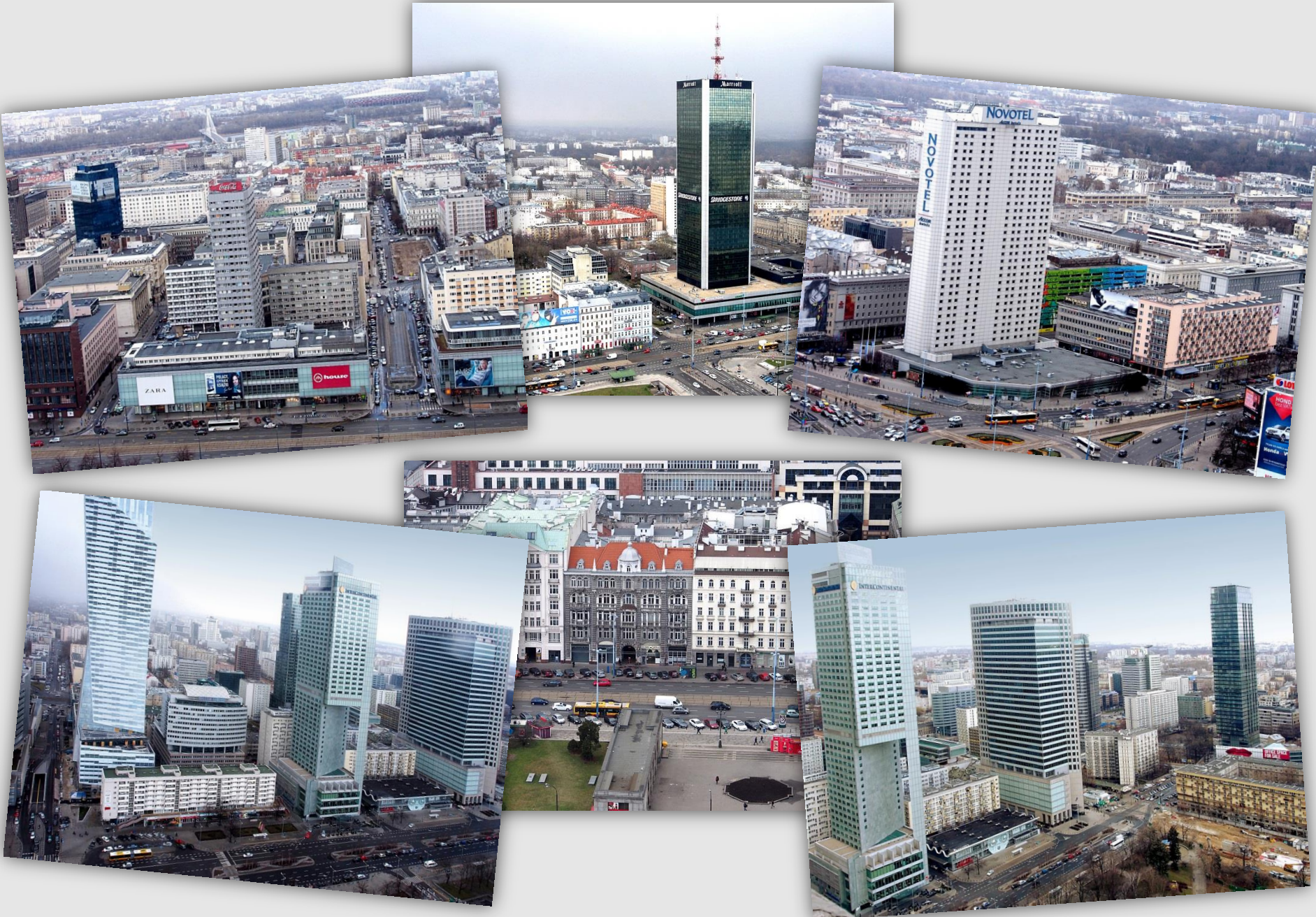
Centrum Warszawy widziane z XXX piętra Pałacu Kultury i Nauki