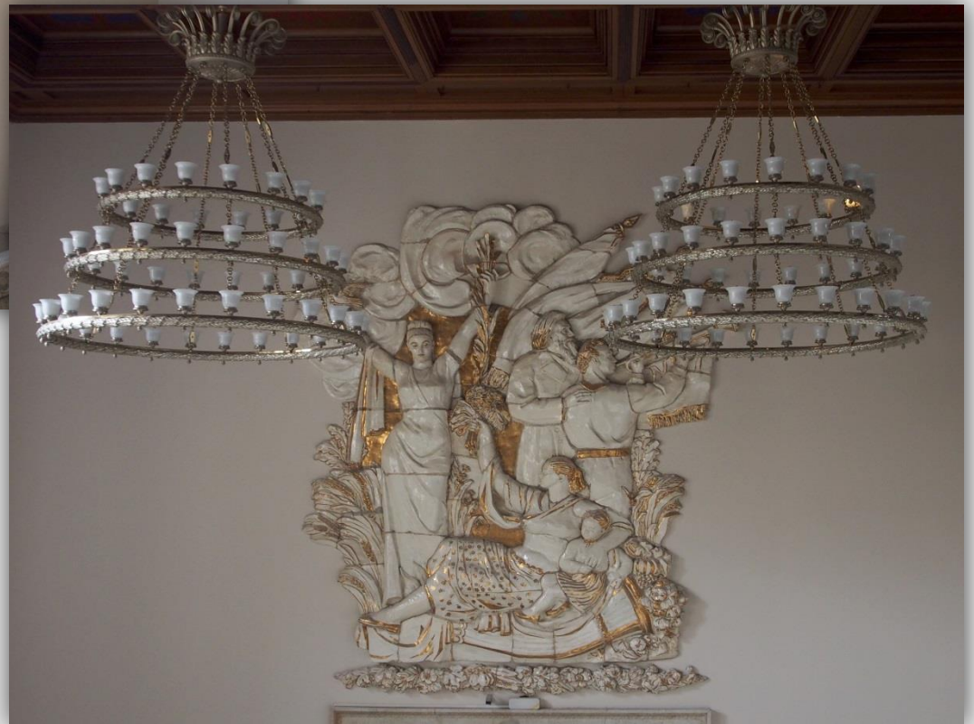
Dekoracja klatki schodowej widziana z wysokości pietra