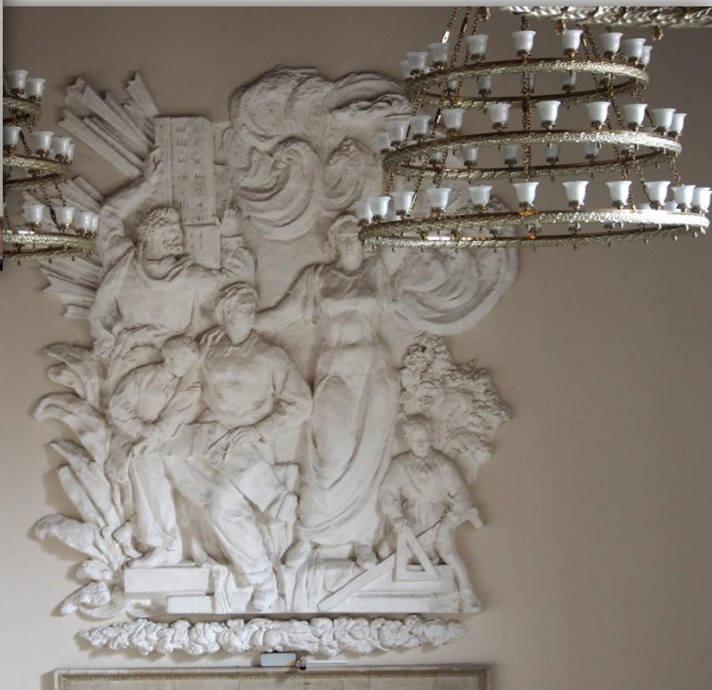
Dekoracja klatki schodowej prowadzącej na piętro