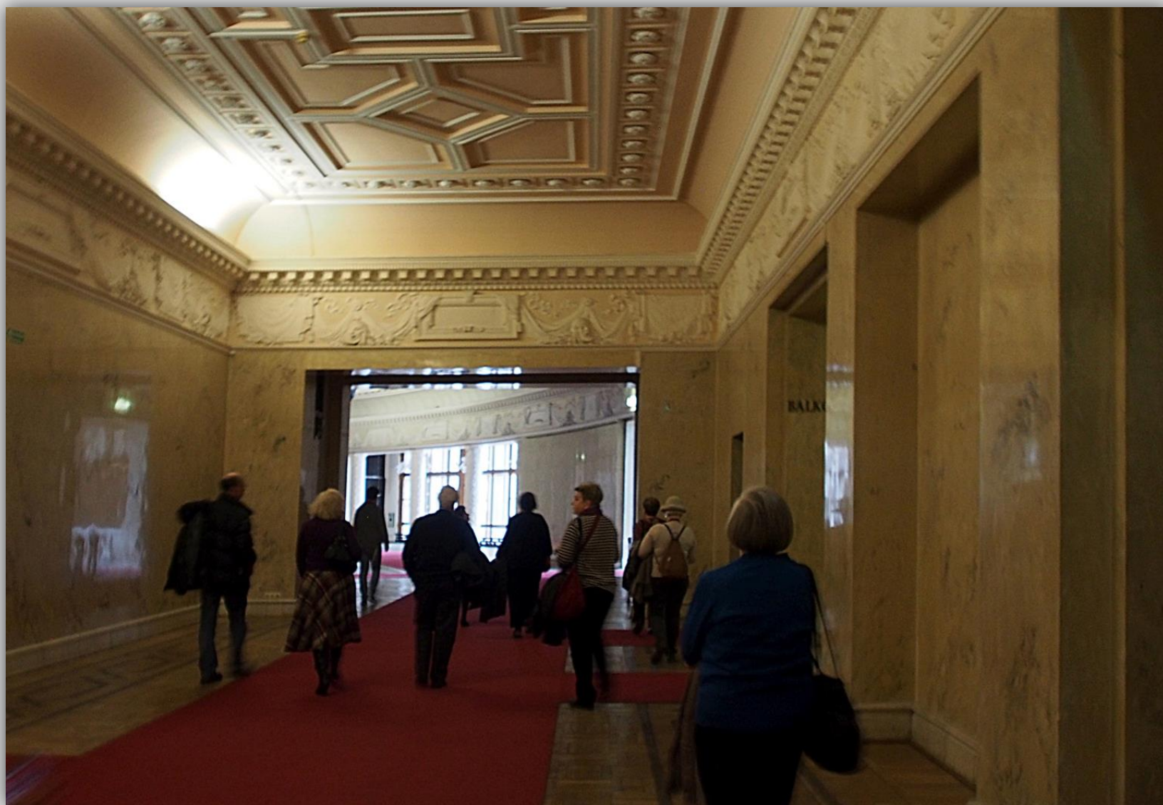
Korytarz marmurowy prowadzący do Sali Kongresowej