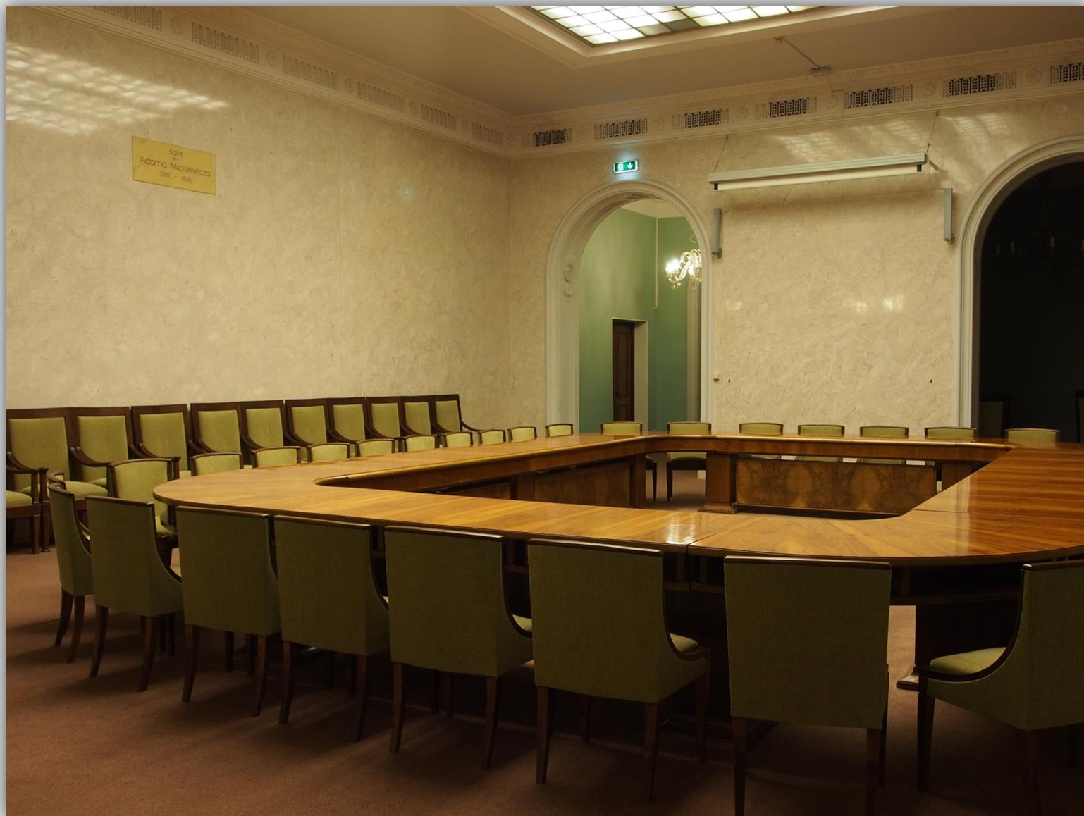
Stół konferencyjny w sali obrad