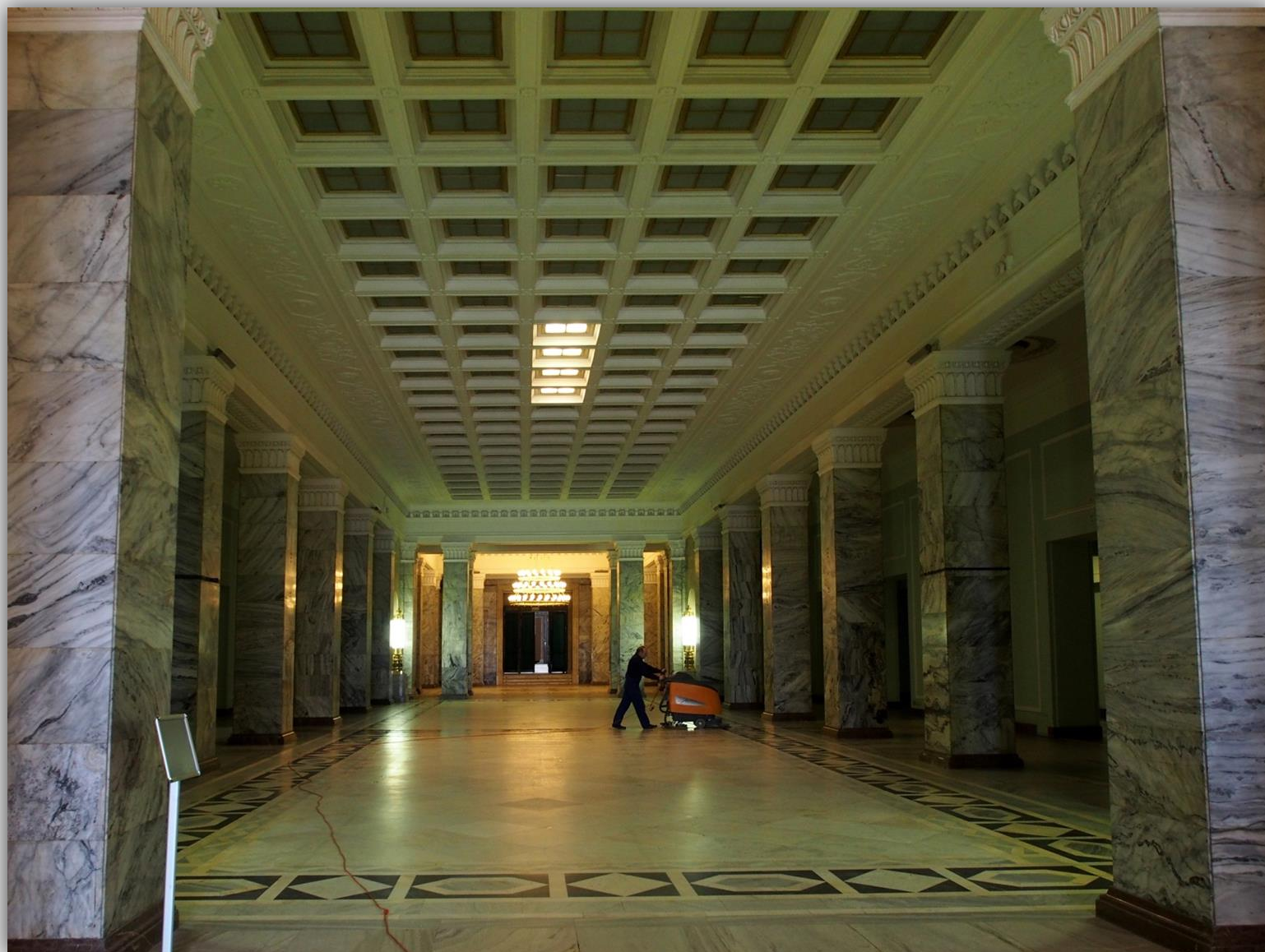
Korytarz wykonany z marmurów, prowadzący do Sali Marmurowej