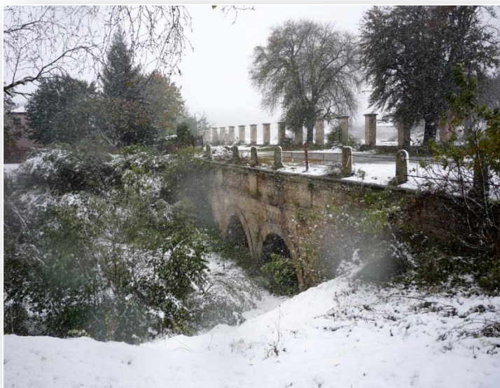
Stary most na rzece w Brodach