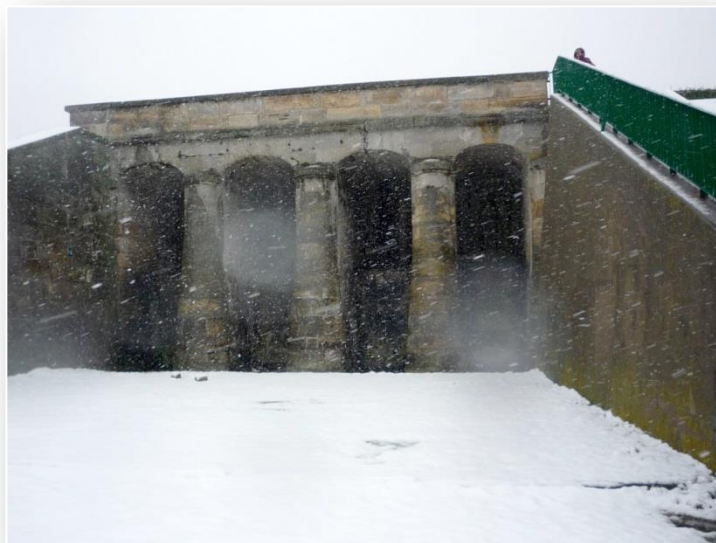
Element zapory z czasów Stasica, wbudowany w nową zaporę