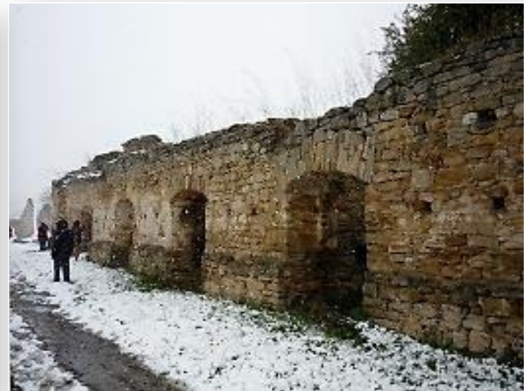
Ruiny walcowni w Nietulisku Dużym