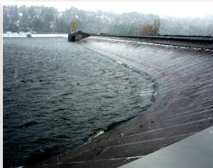
Zapora na rzece Kamiennej