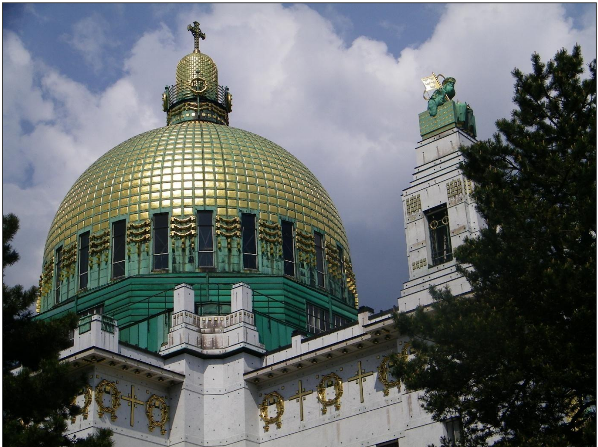
Kościół am Steinhof w Wiedniu

Nad modrym, pięknym Dunajem, na żyznych terenach obdarzonych łagodnym klimatem, ludzie mieszkali już od epoki neolitu. Z czasem wyrosła tam osada, Vindobona, która na przestrzeni wieków zamieniła się w kwitnące miasto pełne skarbów architektury. Wspaniałe kościoły, pałace, kamienice miejskie i budynki użyteczności publicznej wznoszone w Wiedniu od średniowiecza aż po czasy współczesne czynią spotkanie z tym miastem fascynującą lekcję architektury. Zaś układ urbanistyczny, powstały po likwidacji średniowiecznych fortyfikacji, to znakomity przykład połączenia logiki i ładu z estetyką.