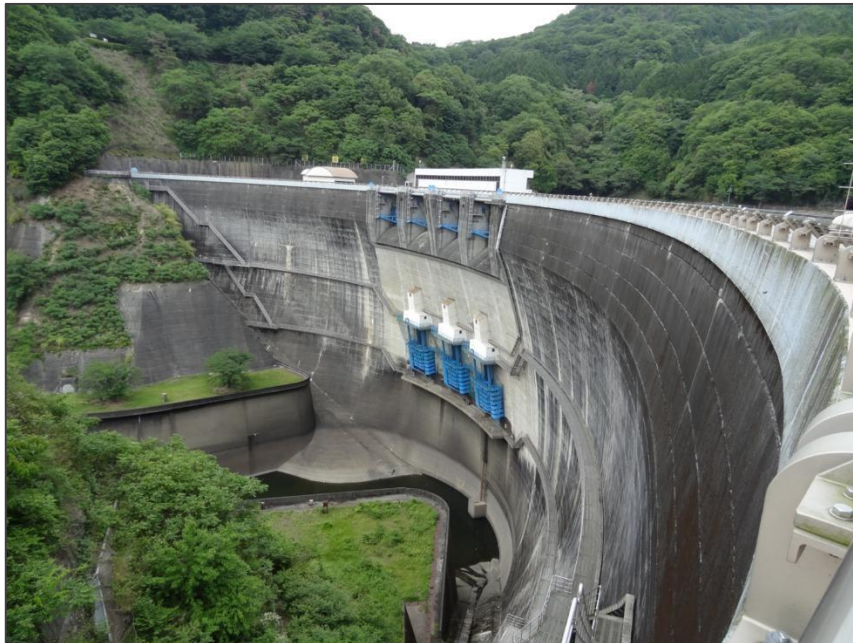
Zapora AMAGAZE z r.1964 na rzece Uji – Japonia, wysokość 73 m

Wielkie rzeki i zbiorniki od zawsze przyciągały osadnictwo, były i są naturalnymi dostarczycielami żywności (połów ryb), wygodnymi szlakami komunikacji, naturalnym zapleczem dla rozwoju ośrodków życia kulturalnego, gospodarczego i politycznego. Wszystkie znaczące cywilizacje rozwinęły się nad rzekami. Odnosi się to do Egiptu, Mezopotamii, Chin, Indii. Tylko Grecja i Rzym, z uwagi na ich uwarunkowania geograficzne, związane były z morzem. Bez wody nie ma życia. Kluczowym elementem racjonalnej gospodarki wodnej są zapory wodne, wznoszone w celu: zaopatrzenie w wodę ludności, przemysłu, rolnictwa, gospodarki leśnej, produkcji energii elektrycznej (wcześniej źródło mocy mechanicznej), ochrony przed powodzią, poprawy warunków żeglugi, rybołówstwa czy wreszcie dla sportu i rekreacji. Na wykładzie zostaną przedstawione najciekawsze konstrukcje, ich rodzaje oraz przesłanki budowy.