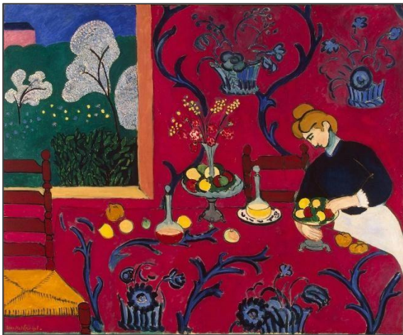
Henri Matisse, Deser: Harmonia w czerwieni

Zapoczątkowana przez impresjonistów emancypacja koloru i celebrowanie światła słonecznego w malarstwie zaowocowały dalszymi poszukiwaniami artystycznymi, które szły w różnych kierunkach: w stronę ekspresji, symbolu czy formy. Kierunki tych poszukiwań miały swoje odzwierciedlenie w nazwach, które licznie pojawiają się wtedy w użyciu, takich jak fowizm, kubizm, symbolizm, nabizm, intymizm, ekspresjonizm i inne.